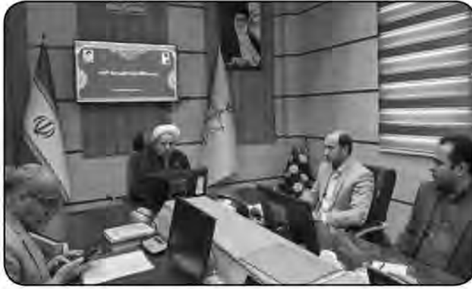
تنها اشخاص حقوقی امکان رأی دهی داشتند، اما با این اصلاحیه، همه اعضا می توانند در تصمیم گیری های مهم شرکت کنند.

نشده و دلیل این مسئله، تخصیص نیافتن زمین توسط شهرداری به اداره راه و شهرسازی و سپس شرکت گاز بوده است. نسای زهان یادآور شد: بر اساس مصوبه این جلسه باید ۱۶ متر زمین مورد نیاز، با دستور مقام قضایی، در اختیار شرکت گاز قرار گیرد و روند گازرسانی تسریع شود. وی همچنین به موضوع حق عضویت اعضای تعاونی اشاره کرد و گفت: حدود ۱۴ سال پیش، هر نفر مبلغ ۶۰۰ هزار تومان پرداخت کرده بود که مقرر شد این مبلغ به عنوان سهام ثبت شود و جزو دارایی اعضا قرار گیرد. وی تأکید کرد: افراد باید مطالبات خود را از طریق قانونی پیگیری کنند، با توجه به اینکه مشکلات صنوف آلاینده با رایزنی های لازم رفع شده است هرگونه تجمع افراد در این خصوص غیرقانونی بوده و در صورت مشاهده برخورد قانونی لازم صورت خواهد گرفت.