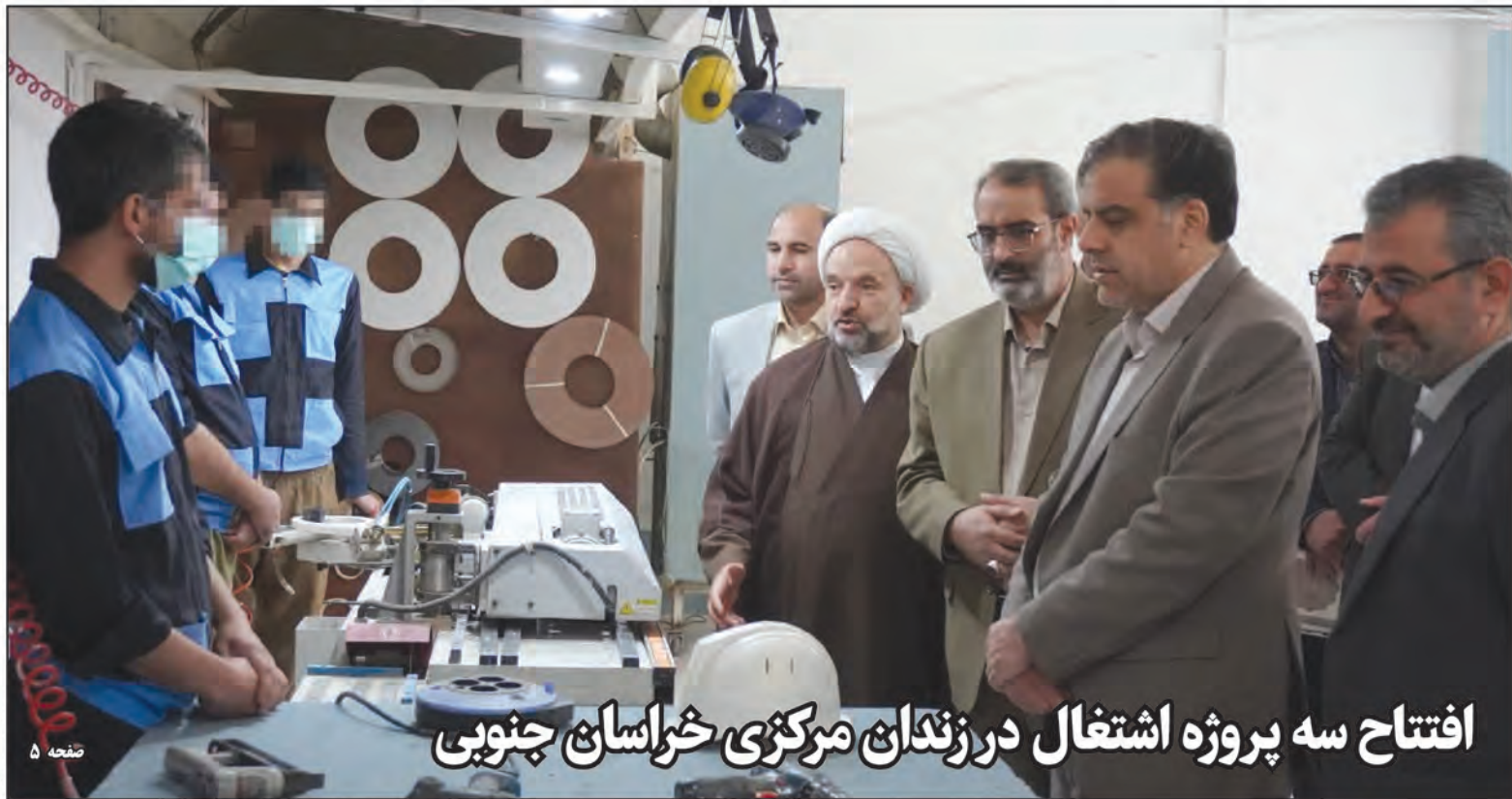
افتتاح سه پروژه اشتغال در زندان مرکزی خراسان جنوبی