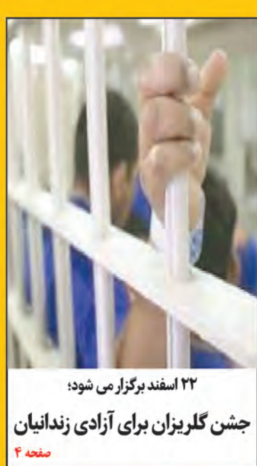
۲۲ اسفند برگزار می شود؛ جشن گلریزان برای آزادی زندانیان صفحه ۴