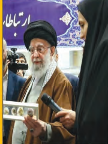
ایده بانوی کارآفرین استان در نگاه رهبری

سرانه واریزی مدارس در خراسان جنوبی کافی نیست