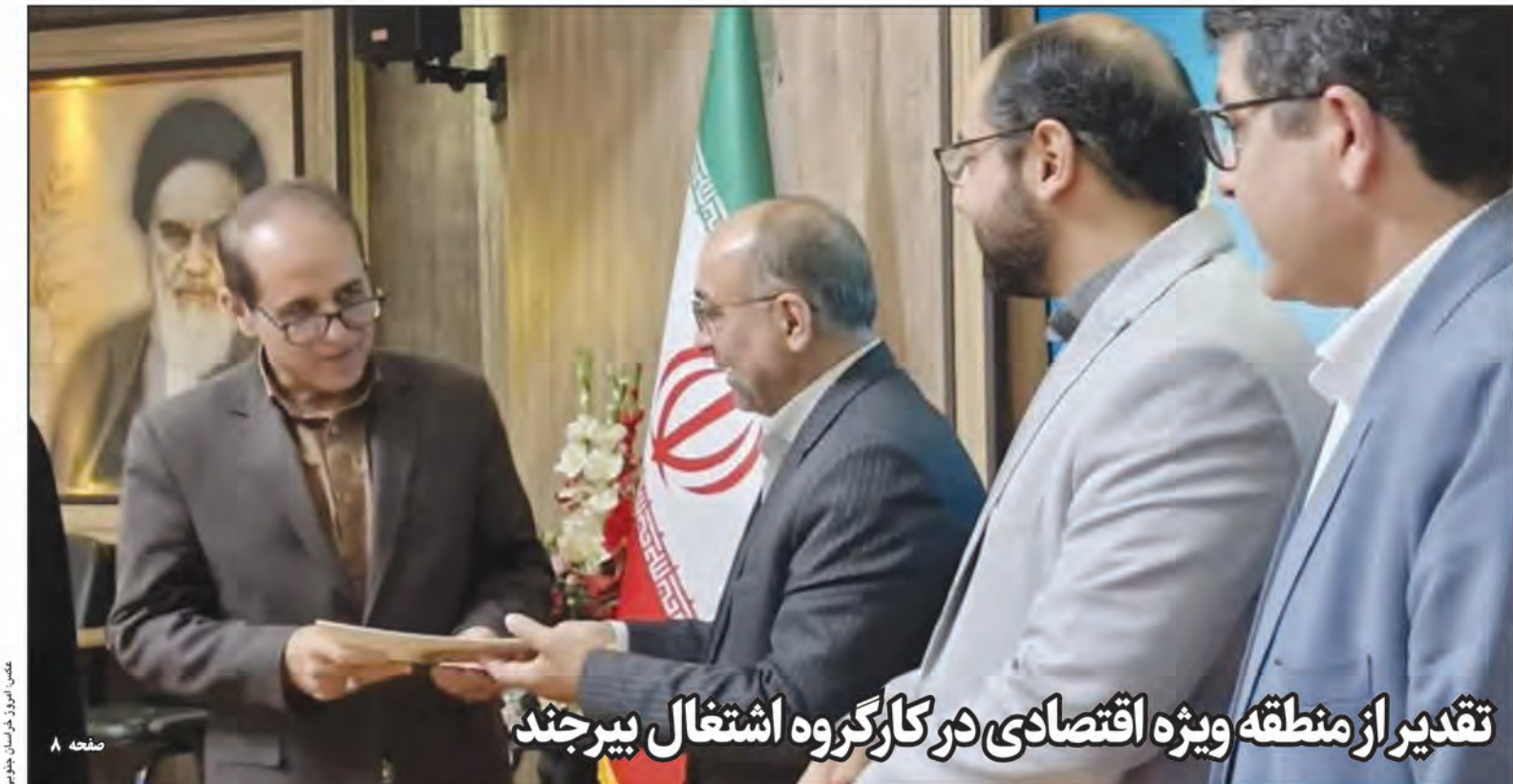
تقدیر از منطقه ویژه اقتصادی در کارگروه اشتغال بیرجند

وزیر تعاون، کار و رفاه اجتماعی گفت: میزان افزایش حقوق کارگران نزدیک به ۳۰ درصد خواهد بود و بر اساس تورم افزایش خواهد یافت. به گزارش خبرگزاری صدا و سیما، وزیر تعاون، کار و رفاه اجتماعی در حاشیه جلسه هیئت دولت ضمن اعلام این خبر افزود: برآورد ما بر اساس نرخ تورم است که تا پایان بهمن ماه ۳۲ درصد اعلام شده است. احمد میدری بیان داشت: باید نرخ جدید تورم را تا پایان بهمن ماه محاسبه کنیم و تصمیم گیری کنیم. وزیر تعاون، کار و رفاه اجتماعی همچنین درباره قطع یارانه برخی از دهک های درآمدی جامعه، گفت: یارانه ۱۰۰ هزار نفر در پایان اسفندماه قطع می شود. زیرا در سه سال گذشته قطع نشده بود. احمد میدری تصریح کرد: این تکلیفی است که مجلس مشخص کرده است و بر اساس قانون بودجه انجام می شود. یعنی کسانی که خودروی بالای پنج میلیارد و خانه بالای ۳۵ میلیارد دارند. اینها از سازمان امور مالیاتی استعلام شده و یارانه آنان قطع خواهد شد.