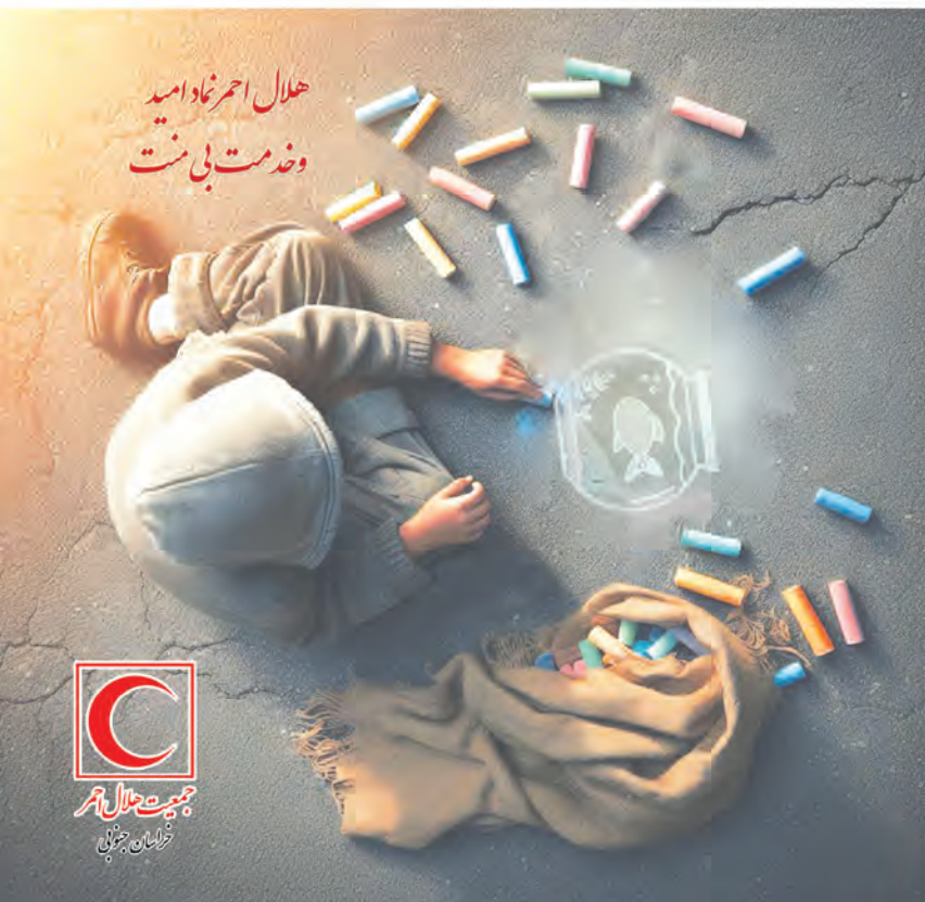
حلال احمد نهاد امید و خدمت بی منت