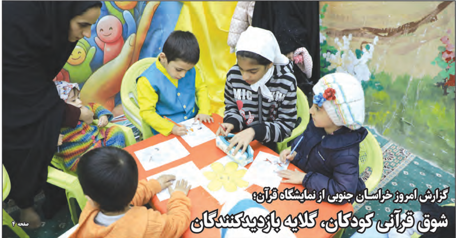
گزارش امروز خراسان جنوبی از نمایشگاه قرآن؛ شوق قرآنی کودکان، گلایه بازدیدکنندگان