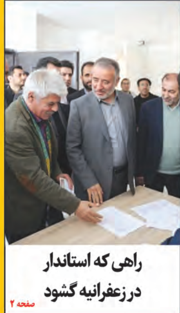
راهی که استاندار در زعفرانیه گشود صفحه ۲