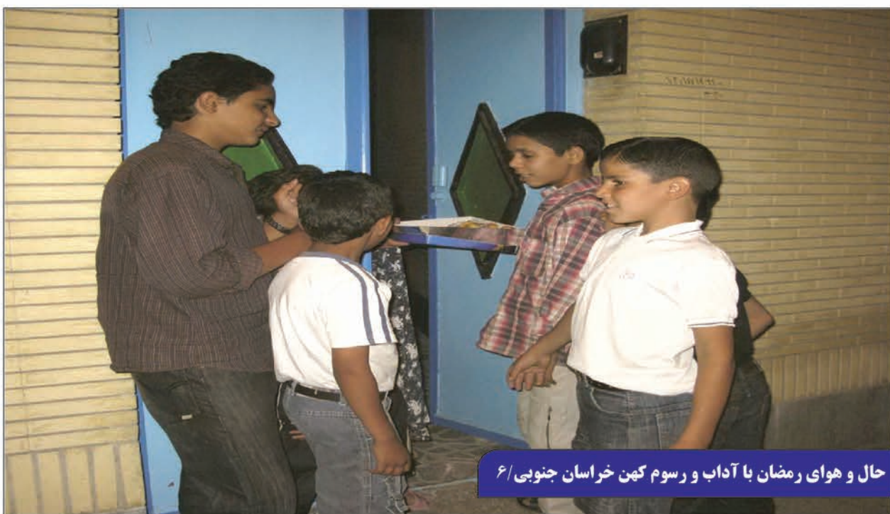
حال و هوای رمضان با آداب و رسوم کهن خراسان جنوبی/۶