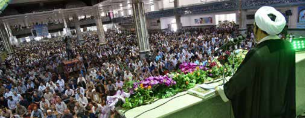
فرمانروایان خراسان جنوبی

امام جمعه طیس با تاکید بر اینکه رقابت های ایام انتخابات به رفاقت تبدیل شود،گفت: زمزمه هایی شده، افرادی که در ادارات با ستاد کاندیدای خاص همکاری نکرده‌اند با آن‌ها برخورد می‌شود. به گزارش مهر، حجت الاسلام سید ابراهیم مهاجریان مقدم در خطبه های نماز جمعه شهرستان طیس ضمن تسلیت ایام ۱۵ خرداد به سالروز ارتحال امام در ۱۴ خرداد اشاره کرد و افزود: انقلاب پس از رحلت بنیانگذار آن به سکانداری مقام معظم رهبری رسید که اکنون پس از ۲۴ سال در مقابل تمام توطئه‌ها علیه ایران اسلامی با درایت ایشان با قدرت و صلابت به پیش می‌رود. وی به انتخابات ایران اشاره و بیان کرد: صحت انتخابات تایید شد و از طرفی گفته شد تخلفات در این دوره بی سابقه بوده است. وی افزود: تخلفاتی از سمت مجریان امر انتخابات صورت گرفت که آیت ...ا جنتی گفتند «باید توبه کنند» که البته باید گفت توبه حق