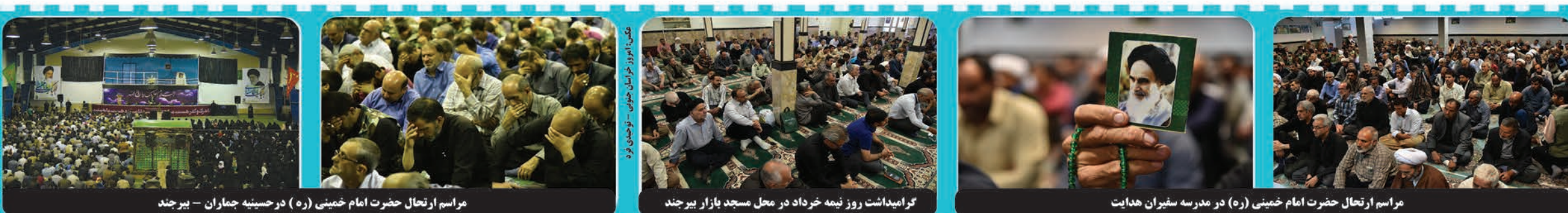
مراسم ارتحال حضرت امام خمینی (ره) در حسینیه جماران - بیرجند