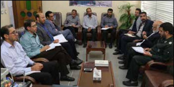
امروز خراسان جنوبی