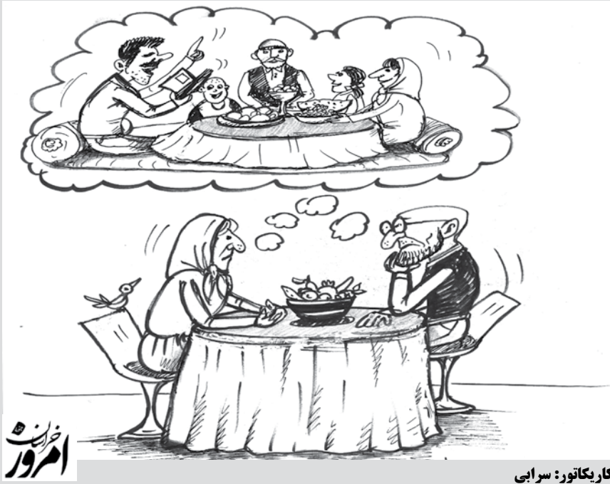
کار یکتاور: سرابی

رقابت های فوتسال جام رمضان در رده سنی کودکان و نوجوانان در شهر اسفدن شهرستان قاین آغاز شد. به گزارش امروز خراسان جنوبی، این مسابقات به صورت رایگان و با حضور ۱۲تیم در رده سنی کودکان و نوجوانان از ۲۴خردادماه آغاز و تا پایان ماه مبارک رمضان ادامه دارد. گفتنی است این رقابت ها با همکاری فرهنگسرای حمایت از حقوق کودکان شهر اسفدن، اداره ورزش وجوانان و مجتمع فرهنگی ورزشی سردار شهید ناصری اسفدن برگزار می شود.