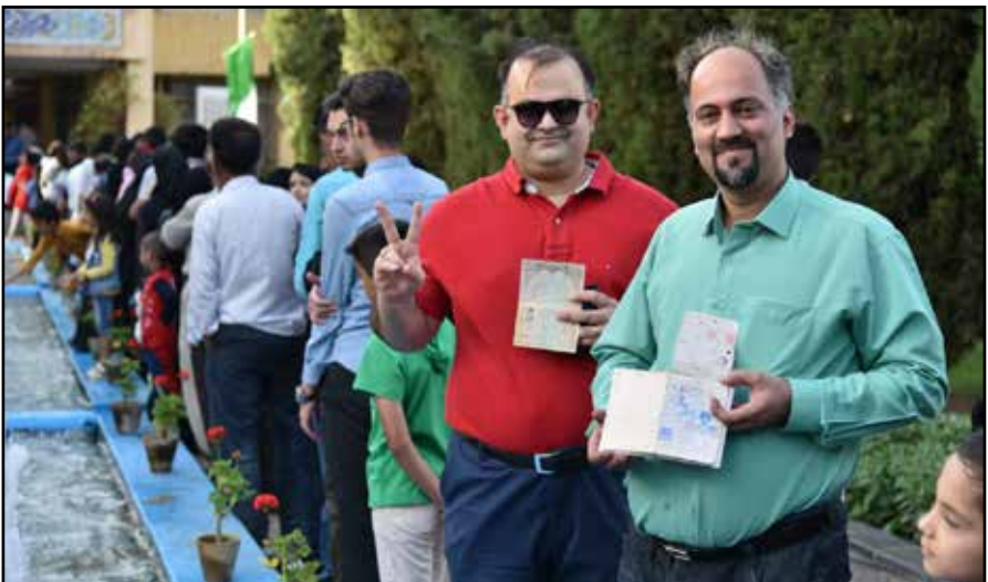
عزم دولت برای محرومیت زدایی از استان

تحلیل آرای مردم استان در انتخابات ریاست جمهوری