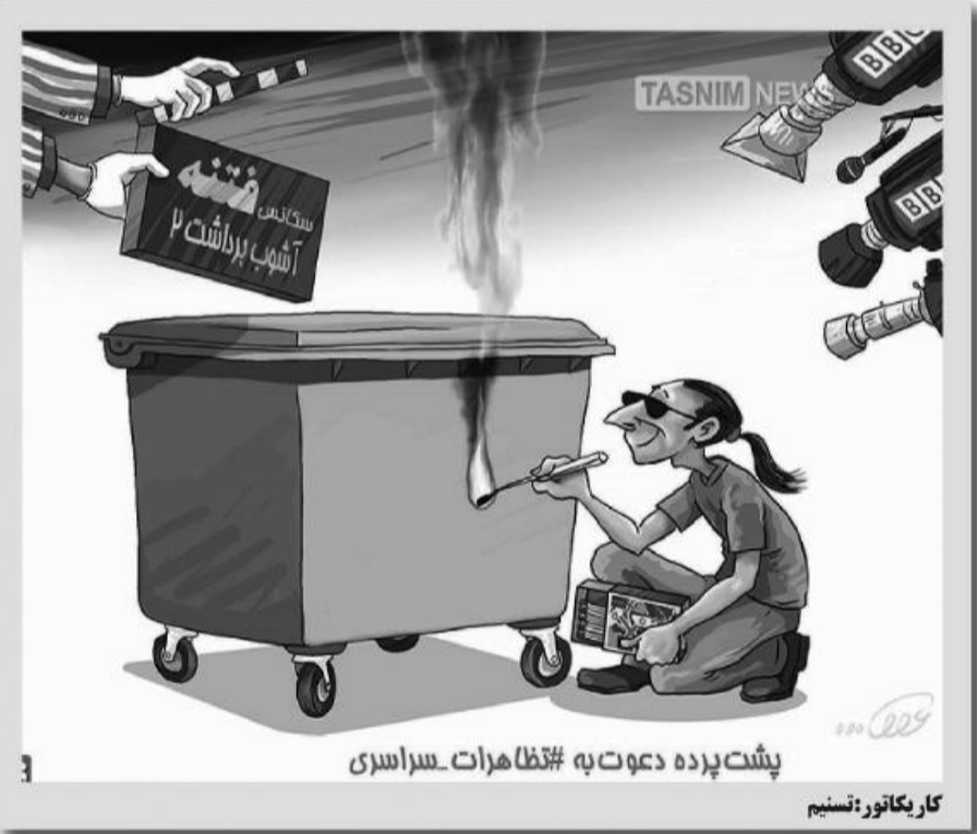
پشت پرده دعوت به #تظا هرات سراسری کار یکتاور: نسیم

برگزاری همایش پیاده روی خانوادگی در میان همایش بزرگ پیاده روی خانوادگی در روستای نصرالدین شهرستان درمیان برگزار شد. این همایش به مناسبت نهم دی ماه روز بصیرت و میثاق با ولایت با حضور ۲۰۰ نفر از اهالی روستا و ورزشکاران در روستای نصرالدین بخش گرزیک برگزار شد. در پایان نیز به قید قرعه به شرکت کنندگان جوایزی اهدا شد.