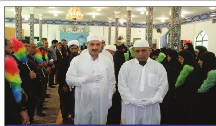
در آیین معنوی شبارویی مرقد مطهر امام زاده گان باقر (ع) مطرح شد: