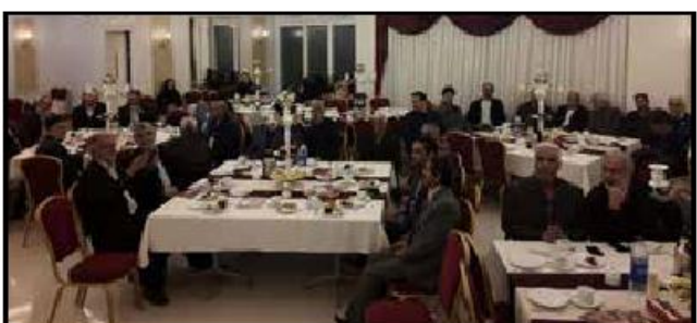
امروز خراسان جنوبی- قاسمی

«افضل پور» در مراسم «یاد یاران»: افتخارات ورزشی مروهون پیشگستوان است