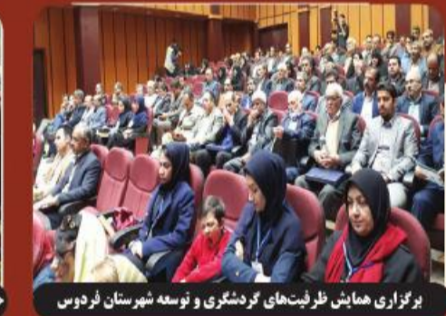
برگزاری همایش ظرفیت‌های گردشگری و توسعه شهرستان لردوس