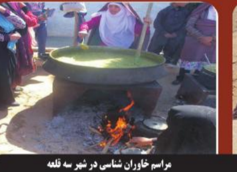
مراسم خواران شناسی در شهر سه قلعه