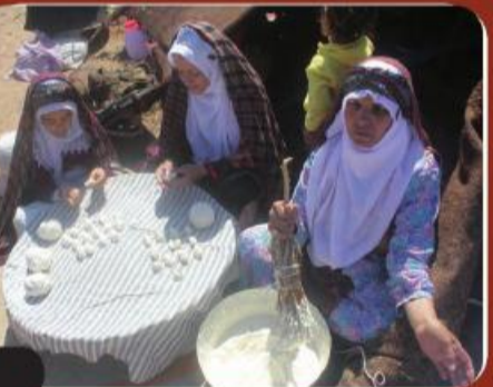
مراسم خواران شناسی در شهر سه قلعه