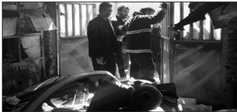
حادثه ایست که در شش ماهه پایان سال ۹۶ در خیابان عدل اتفاق افتاده است.