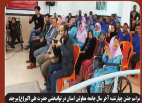
مراسم جشن چارشنبه آخر سال جامعه معلولان استان در نوابشاهی حضرت علی (ع) بیرجند