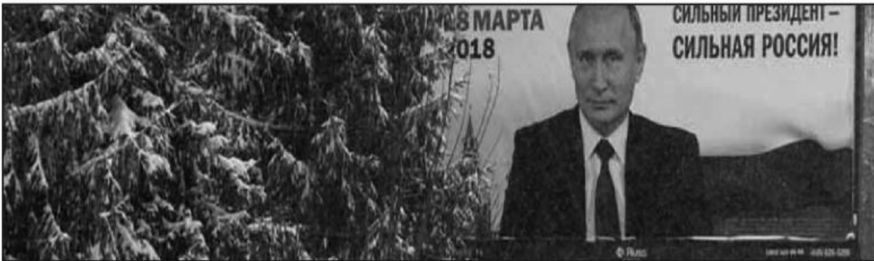
تتش آفرینی روسیه در تحولات جهانی در سایه ریاست جمهوری پوتین