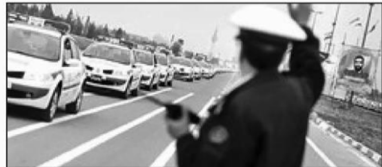
امروز خراسان جنوبی- کاظمی فرد اجرای رزمایش نوروژی پلیس و نیروهای امدادی از امروز در استان آغاز می شود.

های استان از امروز ۲۴ اسفند ماه شروع و تا ۱۵ فروردین ۹۷ ادامه خواهد داشت. سرهنگ حسین رضایی با اشاره به واژگونی سواری لیپان در محور شوسف-نهبندان ۵ هم گفت در این حادثه ۵ مصدوم شده اند و علت حادثه تخطی از سرعت مطمئنه می باشد. سردار مجید شجاع ، فرمانده نیروی انتظامی استان چندی قبل در نشست خبری از حضور پررنگ و ۱۰۰ درصدی پلیس در ایام آخر سال و تعطیلات نوروژی با هدف ایجاد امنیت و آرامش برای شهروندان و مسافران و میهمانان نوروژی خبر داد ه و گفته بود: در این ایام ۱۰۰ دستگاه خودرو به صورت محسوس و حدود ۲۰ دستگاه خودرو به صورت نامحسوس وظیفه کنترل ترافیک را برعهده دارند.