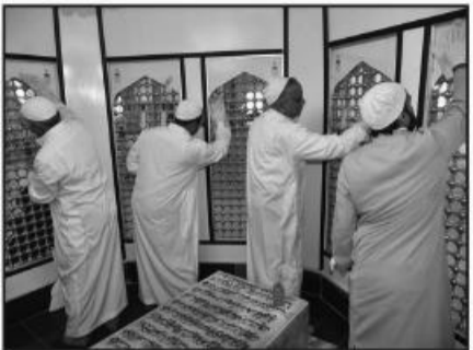
بیده شده است.

محمدی به استقبال چند هزار نفری مردم از برنامه های فرهنگی این مکان مقدس در مناسبت های مختلف اشاره کرد و افزود: امامزادگان باقریه به امامزادگان سریع الاجابه مشهورند و کرامات زیادی از آنها توسط مردم