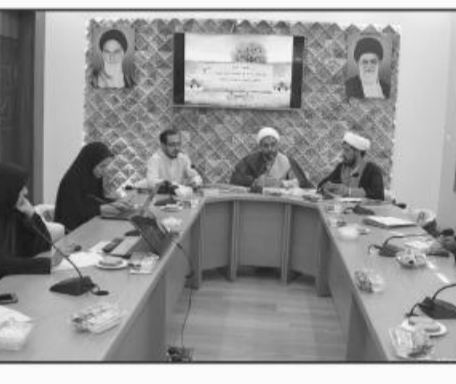
سرپرست اداره کل اوقاف و امور خیریه استان از تهیه ۸۶ هزار قلم جوایز و هدایا برای اجرای مسابقات فرهنگی به ویژه برای تشویق کودکان و نوجوانان در قالب طرح آرامش بهاری خبر داد و با اشاره به اینکه آمار تعداد زائران بقاع متبرکه را هر دو روز اعلام خواهیم کرد.

افزود: سطح بندی بقاع متبرکه براساس خدمتی که در آنها ارائه می شود و تعداد زائران و مراجعین و امکانات مستقر صورت می گیرد. وی همچنین گفت: در سطح بقاع متبرکه استان تعداد ۵۴۳ باب زائرسرا، ۷۸ سوئیت و ۱۸ کانکس و در مجموع ۶۳۹ مکان برای اسکان شبانه زائران داریم و در راستای طرح ایجاد و مرمت سرویس های بهداشتی نیز ۹۵۷ سرویس بهداشتی، ایجاد و مرمت گردیده و ۳۳ باب آشپزخانه احداث شده است.