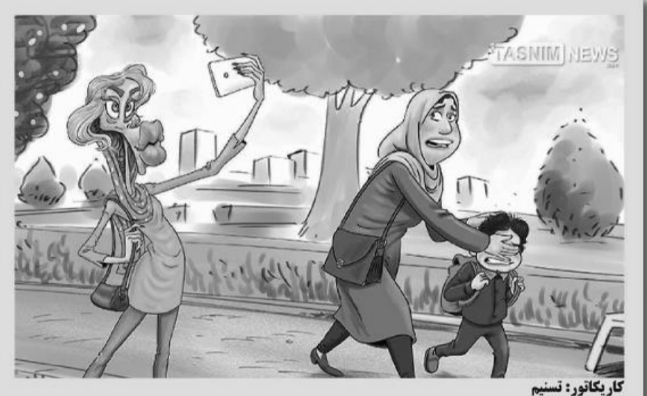
کار یکتاتور: نسیم