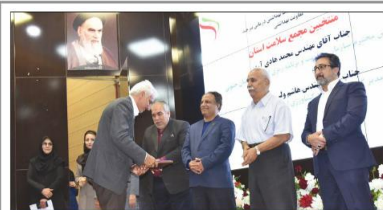
در همایش گرامیداشت هفته سلامت عنوان شد: ارتقای بسیاری از شاخص های سلامت با اجرای طرح تحول سلامت/۸