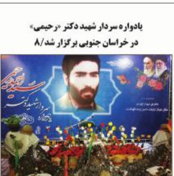
یادواره سردار شهید دکتر «رحیمی» در خراسان جنوبی برگزار شد / ۸