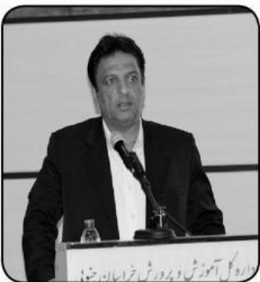
جاری ۸۰ سرباز معلم در آموزش و پرورش استان فعالیت داشته اند، اضافه کرد: تا اول مهر سال جاری حدود ۶۷۲ نفر واجد شرایط بازنشستگی در استان داریم.

از معلم با حضور مسؤلان استانی این هفته برنامه دارد. او با بیان اینکه مراسم گرامیداشت یاد متوفیان فرهنگی استان نوزدهم اردیبهشت ماه در مسجد امام صادق(ع) ساعت ۱۰ صبح برگزار می شود، عنوان کرد: غبارروبی مزار شهدا، عیادت از بیماران در تمامی شهرستان ها و دیدار با خانواده های شاهد فرهنگی از جمله برنامه های آموزش و پرورش در هفته گرامیداشت مقام معلم است. به گفته وی پیشکسوتان پیشانی و تجربه آموزش و پرورش هستند، به همین دلیل برگزاری مراسم تکریم از پیشکسوتان فرهنگی بیستم اردیبهشت در اردوگاه استانی هدایت برنامه ریزی شده است.