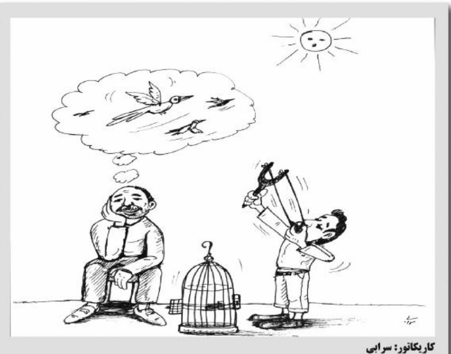
کار یکاتور: سرابی

هفته معلم شد امروز خراسان جنوبی- آنوشه مسابقات والیبال ویژه بانوان در شهرستان نهبندان برگزار شد و در پایان تیم فرهنگیان فدک فاتح مسابقات والیبال هفته معلم شد. رئیس اداره ورزش و جوانان شهرستان نهبندان با اعلام این خبر گفت: