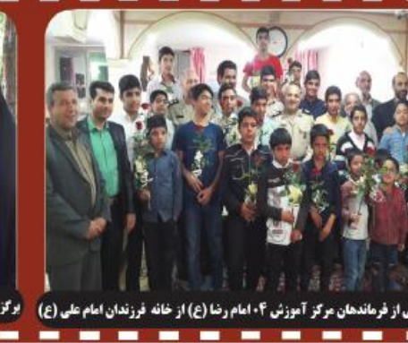
دیدار جمعی از فرماندهان مرکز آموزش ۰۴ امام رضا (ع) از خانه فرزندان امام علی (ع)