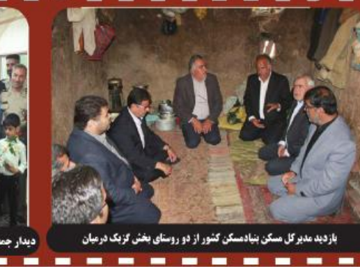
باربد مدیرکل مسکن بیداستگن کتور از دو روسای بخش لرنگ در میان