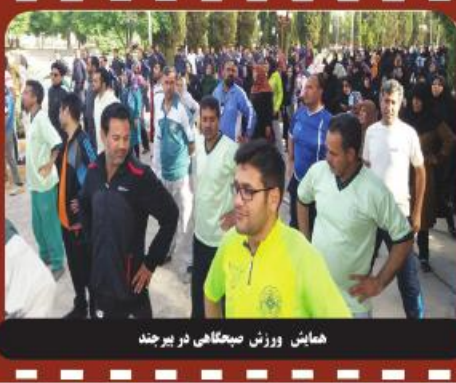
همایش ورزش صیقلی در بیرجند