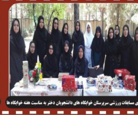
برگزاری مسابقات ورزشی سربازان خاکیگاه های دانشجویان دختر به مناسبت هفته خوابگاه ها