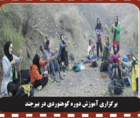
برگزاری آموزش دوره کوهنوردی در بیرجند

ما راهی را با هم شروع کرده ایم و تا پایان باید با هم ادامه دهیم.