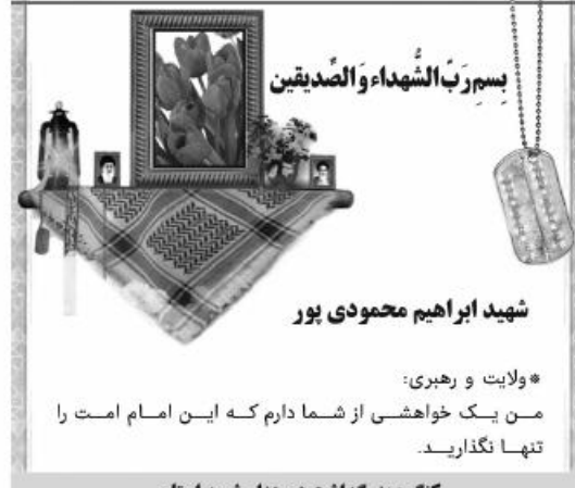
شهید ابراهیم محمودی پور