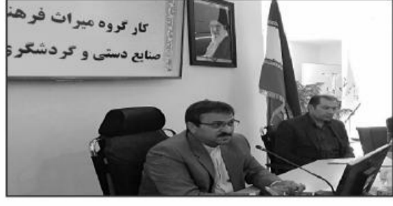
کار گروه میراث فرهنگی، صنایع دستی و گردشگری