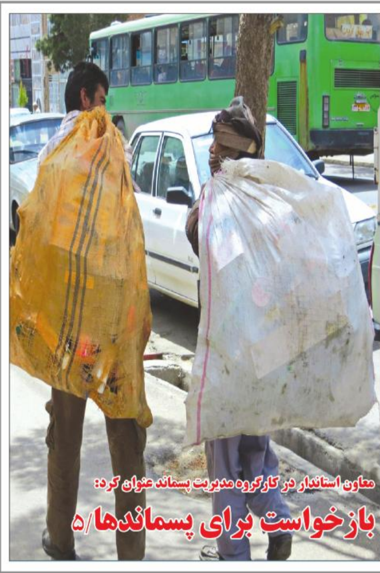
معاون استاندار در کارگروه مدیریت پسماند عنوان کرد: بازخواست برای پسماندها/۵