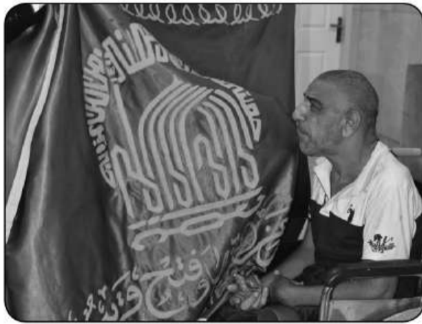
توانبخشی حضرت علی اکبر(ع)