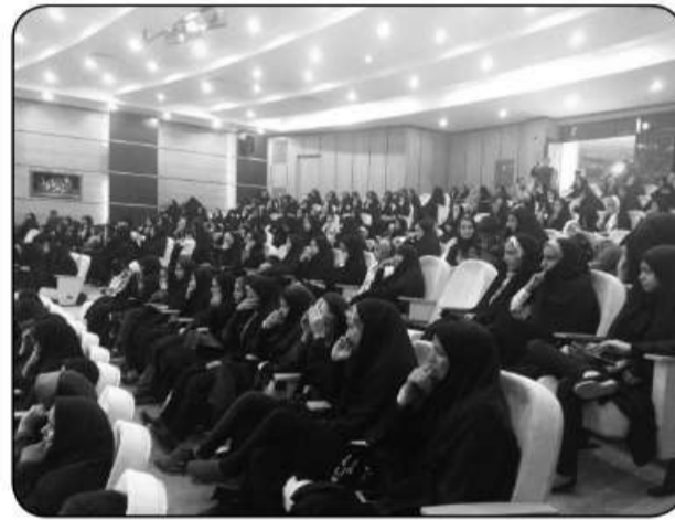
جشن کرامت علوی