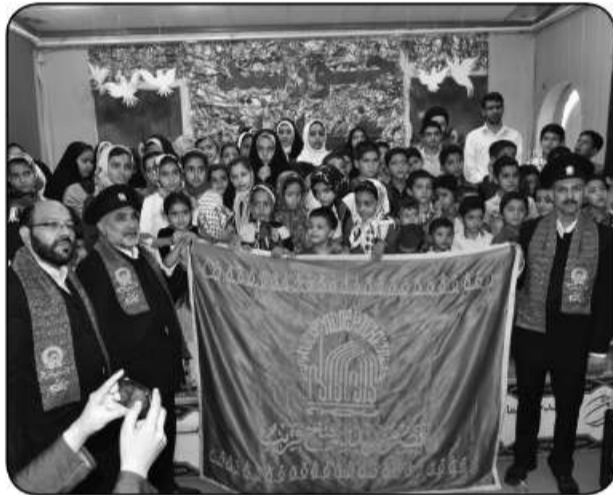
کانون پرورش فکری کودکان و نوجوانان

خادم حرم امام هاشم چند روزی است که شمیم عطر رضوی را در جای جای استان طنین انداز کردند و دیروز نیز معلولان توانبخشی حضرت علی اکبر(ع) بیرجند و کارکنان سرای سالمندان خود را برای پذیرایی از مهمانان حرم امام رضای(ع) آماده کرده بودند. به گزارش امروز خراسان جنوبی، معلولان مرکز توانبخشی با دود کردن اسپند و با داشتن گل از ساعت های اولیه صبح جلوی درب ورودی مرکز ایستادند و خود را آماده دیدار با خادمین بازگاه ملکوتی امام رضای(ع) کردند. شوق دیدار پرچم حرم رضوی آن ها را از ایستادن خسته نگه داشته و همصدا با کارکنان مرکز توانبخشی نوای «آمده ام ای شاه پانهم بده» را با اشک دیده فریاد می زدند. بالاخره زمان انتظار به پایان رسید و مددجویان مرکز با فرستادن صلوات و با گل به استقبال خادمین حرم رضوی رفتند و پرچم امام رضای(ع) را بوسه باران کردند و در زیر لب دعاها را زمزمه و آرزوهایی را طلب می کردند. آری معلولان با قلبی آکنده از مهربانی میزبان خادمین رضوی بودند هر چند سخن به خوبی نمی توانستند بگویند اما با حرکات دست خودشان و بوسه باران کردن پرچم رضوی نشان دادند ارادت ویژه ای به حضرت ثامن الائمه(ع) دارند.