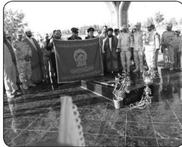
حضور کاروان سایه خورشید در مرکز آموزشی محمد رسول ... (ع)