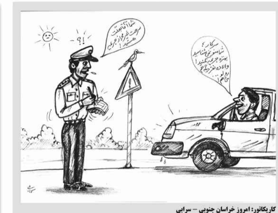
کارنگاتور: امروز خراسان جنوبی - سرابی

پیروزی تیم والیبال جوانان استان در نخستین روز رقابت های والیبال کشور تیم والیبال جوانان خراسان جنوبی در نخستین روز رقابت های والیبال منطقه ۳ کشور به پیروزی رسید. مسابقات قهرمانی منطقه ۳ کشور در رده سنی جوانان، با حضور ۹ تیم از استان‌های خراسان شمالی، خراسان جنوبی، سیستان و بلوچستان، یزد، سمنان، همدان، زنجان و ایلام به میزبانی بجنورد آغاز شد. تیم والیبال جوانان استان دیروز و در نخستین دیدار خود با نتیجه