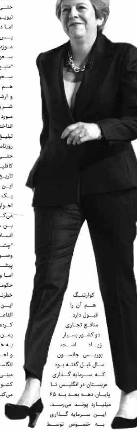
کوارتنگ هم آن را قبول دارد. منافع تجاری دو کشور بسیار زیاد است. بوریس جانسون سال قبل گفته بود که سرمایه گذاری عربستان در انگلیس تا پایان دهه بعد به ۶۵ میلیارد پوند می‌رسد. این سرمایه گذاری به خصوص توسط

پارلمان است. او اخیراً یک سفر تجاری به ارزش ۱۰ هزار پوند به عربستان داشته است. زمانی که از او پرسیدیم چرا با رژیم دیکتاتور سعودی حشر و نشر دارد گفت که اینکه منافع تجاری را قربانی اینگونه ایده ها کنیم بسیار احمقانه و کودکانه است. مع الوصف من پرسیدم که آیا حاضری به کره شمالی سفر کنی و او گفت که نه، حاضر نیستم. مشخص است که رژیم سعودی دوست دارد اعضای دولت انگلیس را جهت تحقق اهداف پروپاگاندایی خود به عربستان بکشاند. به همین علت، بسیاری از انگلیسی ها را با پول جذب می‌کند. و این چیزی است که