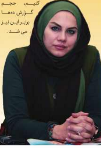
برابر این نیز می شد.