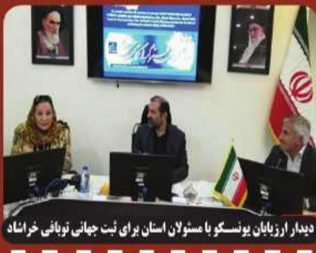
دیدار ارزبایان یونسکو با مسئولان استان برای ثبت جهانی توبانی خراسان