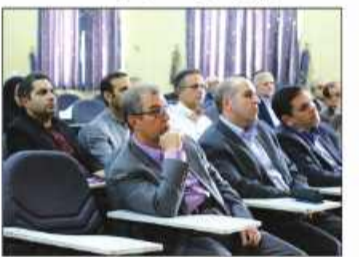
تدوین سند راهبردی دانشگاه بیرجند برای افق ۵ سال آینده ۲