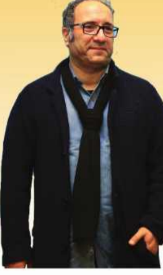
در گزارش حاضر تلاش داریم بخشی از تولیدات سینمای ایران در موضوع فرهنگ عاشورا را که به همت سینماگران شناخته شده در عرصه