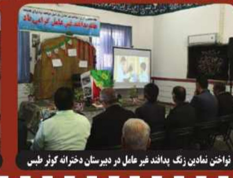
نواختن نمادین زنگ پدافند غیر عامل در دبیرستان دخترانه کوثر طبس