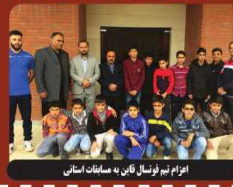
اعزام تیم فورسال قان به مسابقات استانی