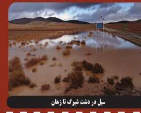
سبل در دشت شیرگ تا زمان