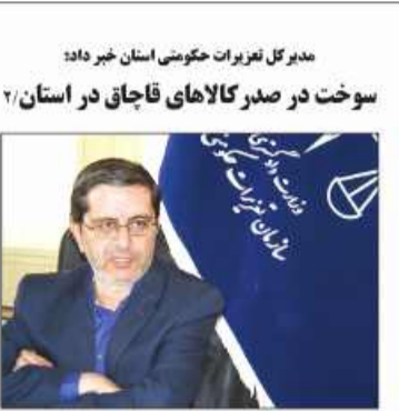
مدیر کل نظریات حکومتی استان خراسان جنوبی سوخت در صدر کالاهای قاچاق در استان ۲