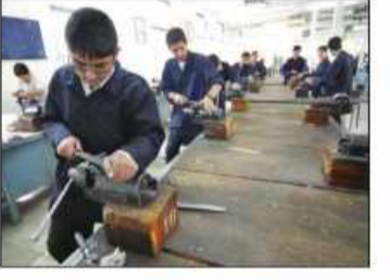
اجرای طرح «ایران مهارت» در خراسان جنوبی ۲

آمادگی سرمایه گذاران اوتاندایی برای صادرات قهوه و محصولات کشاورزی و واردات تایر، سیمان و تکنولوژی از خراسان جنوبی