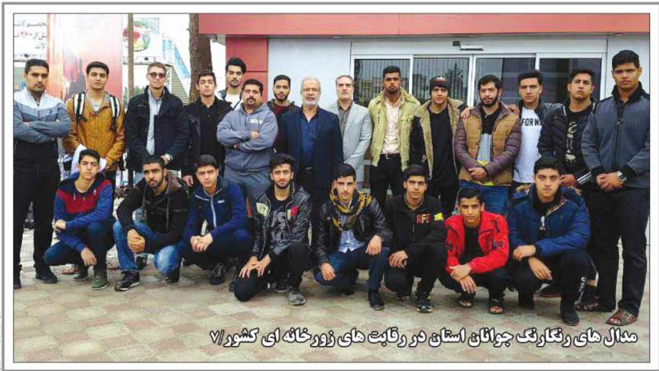
مدال های رقابت های جهانشناسی استان در رقابت های ژورنال ای کشور ۷/۷

آمریکا در تحریم کامل نفت ایران ناکام شد رئیس کل بانک مرکزی جمهوری اسلامی ایران تاکید کرد «امروز دیگر برهنگان مسجل شده است که آمریکا در تحریم کامل نفت ایران و به صفر رساندن آن به هر دلیل و بهانه ای ناکام شده است». به گزارش ایرنا، عبدالناصر همتی عصر دیروز در یادداشتی صفحه اینستاگرام خود نوشت: با معافیت تدریجی کشورهای متعدد از