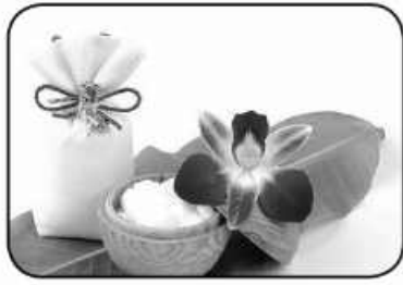
چند خاصیت شگفت انگیز کافور

امروز خراسان جنوبی - خوبی khoii@birjandemrooz.com