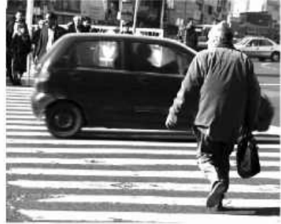
این شائبه مردم که عابریین پیاده در تصادفات مقصر شناخته نمی شوند نیز پاسخ داد و افزود: کارشناسان پلیس در صحنه تصادف چنانچه عابریین

پیاده نکات و الزامات ایمنی و قانونی را رعایت نکرده باشند سهم آنان را مشخص می کنند و این طور نیست که در هر صورت خودروها مقصر باشند. سرهنگ عباسی حقوق عابریین پیاده که در ماده ۱۶۱، ۱۶۲ و ۱۶۳ آیین نامه راهنمایی و رانندگی به آن اشاره شده است را برای پلیس حائز اهمیت می دانست و از برخورد جدی با رانندگانی که امنیت عابر پیاده را در خطوط عابر پیاده روها و... به خطر می اندازند خبر داد. وی در پایان از رانندگان خواست هنگام رانندگی توجه کافی به جلو و رعایت سرعت مطمئنه را مد نظر قرار دهند و هنگام رسیدن به خطوط عابر پیاده توقف کنند تا عابران با امنیت کامل از عرض خیابان عبور کنند.