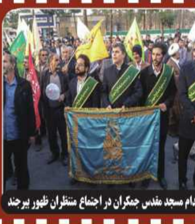
حضور خدام مسجد مندیس چمرکان در اجتماع منتظران ظهور بیرجند