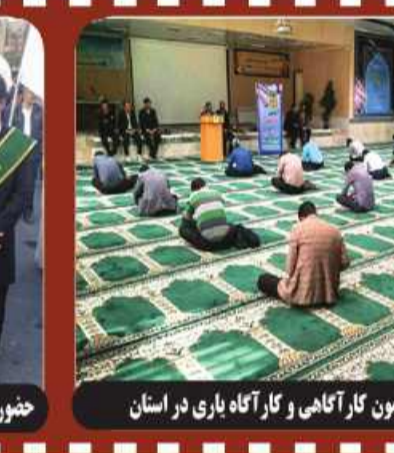
برگزاری آزمون کارآگاهی و کارآگاه یاری در استان