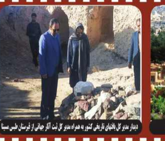
دیدار مدیر گل با نمایان تاریخی کشور به همراه مدیر گل نبش آثار چاشنی از نیرسان طیبی سیما

مشکلات زندگی مردم عادی فاصله ای از زمین تا آسمان دارد.