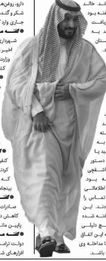
خالد بن سلمان

کارگران هفت تپه خوزستان با حضور در مقابل فرمانداری شوش برای سیزدهمین روز پیاپی نسبت به پرداخت نشدن حقوق و مطالبات خود اعتراض کردند...»