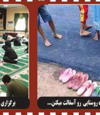
بر اولین بار وقتی به جاده روستایی رو آنالیت میکنم...