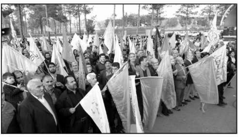
با همکاری استاندار و مساعدت تولیت آستان قدس رضوی؛