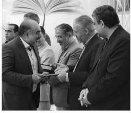
فضای مجازی رقب جدی کتاب و کتاب خوانی

کتابداران و کتابخوانان نمونه استان تجلیل شدند