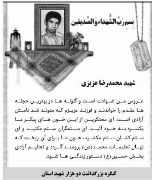
شهید محمدرضا عزیزی

عروس من شهادت است و گلوله ها در بهترین حلقه ها عقدم را خواندند و فرزند عزیزم که متولد شد نامش آزادی است. ای محترمین از این خون های پیکر ما یکسره به خود آئید. ای ستمگران ستم مکنید و ای ستم کشان ستم مکشید، خون ما برای آن ریخت که نبال تعلیمات محمد(ص) برومند گردد و تعلیم آزادی بخش حسین(ع) دستور زندگی ما شود.