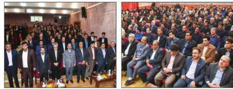
تکلیف امروز خراسان جنوبی