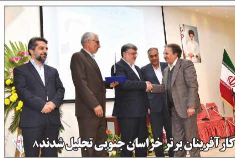
کار آفرینان برتر خراسان جنوبی تجلیل شدند