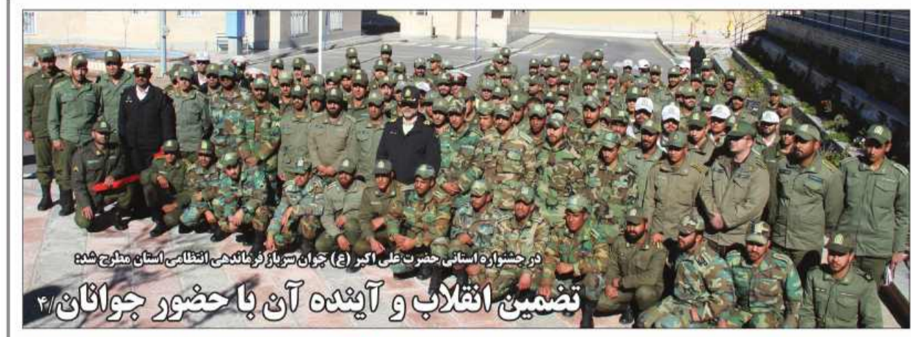
در جشنواره استانی حضرت علی اکبر (ع) جوان سرباز گردان علمی انتظامی استان مطرح شد تضمین انقلاب و آینده آن با حضور جوانان

استاندار خراسان جنوبی با حضور در تیپ ۱۷۷ متحرک هجومی تربیت حیدریه مستقر در شهرستان عسری زیرکوه، از این تیپ بازدید کرد. به گزارش امروز خراسان جنوبی، محمدصادق معتمدیان اظهار امیدواری کرد: ارتش جمهوری اسلامی ایران همچون گذشته در صیانت از مرزهای ایران اسلامی بخصوص مناطق شرقی کشور با همکاری همکاران مرزبانان غیور این منطقه موفق و موید باشد. استاندار خراسان جنوبی ادامه داد: به رغم تهدیدات بالقوه و ناامنی‌هایی که در آن سوی مرزها وجود دارد خراسان جنوبی دارای امنیتی پایدار است که نشان دهنده تلاش شبانه روزی نیروهای نظامی، انتظامی و امنیتی است.