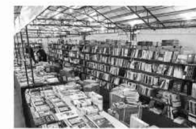
نمایی از غرفه های نمایشگاه کتاب خراسان جنوبی

امضا و شب شعر، شبی با دکتر پورسافعی، شبی با دکتر بهنام فر کارگاه آموزشی استفاده بهینه از فضای مجازی را از جمله برنامه های جانبی این نمایشگاه برشمرد و ادامه داد: کتاب ها و پژوهش هایی که درباره خراسان جنوبی انجام شده است در این نمایشگاه به معرض دید عموم قرار گرفت. وی به رونمایی از ۱۴ کتاب در افتتاحیه نمایشگاه اشاره کرد و گفت: تبلیغات خوبی هم در سطح شهر در قالب ارسال ۲۰ هزار فایل صوتی به گوشی های همراه، ارسال ۱۰ هزار پیامک و نصب بیلبورد در میداين بزرگ و اصلی شهر صورت گرفته است.