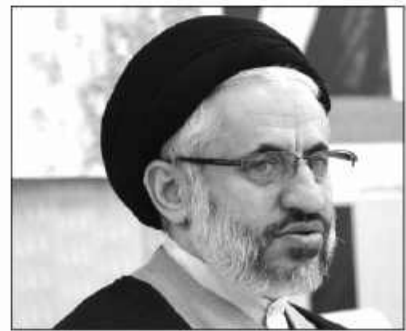
ناعدالتی‌های دکتر نوبخت تشکیل دهید و گزارش آن را به مجلس ارائه نمایید.

هیئتی جهت بررسی ناعادلتی‌های «نوبخت» تشکیل شود