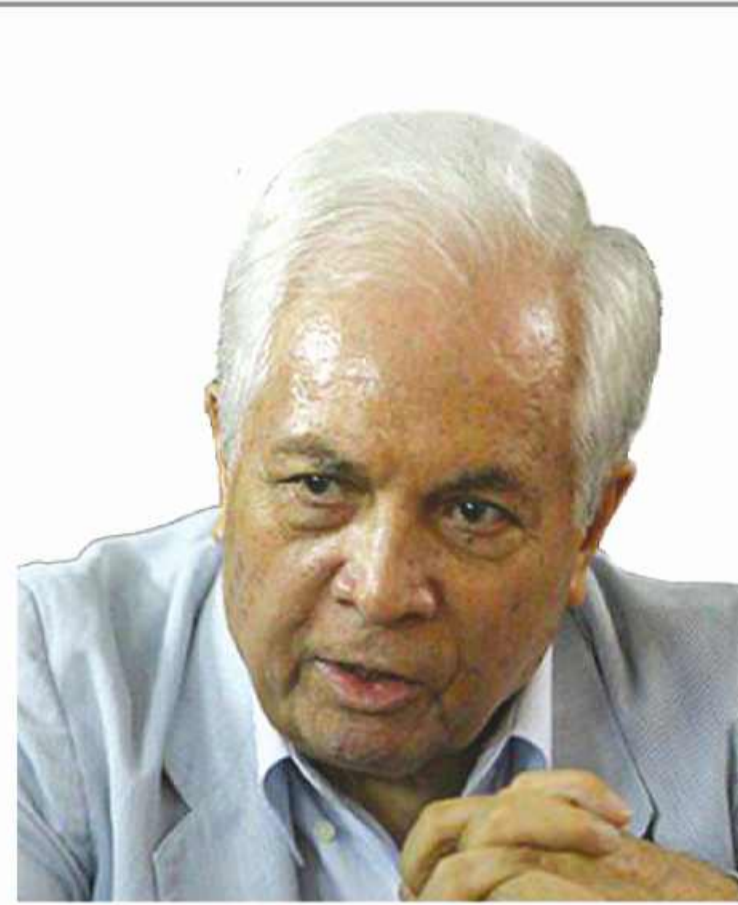
مرحوم پروفیسور معتمدنژاد رهیافت خود را در دانشگاه محبوس نکرد

ماليات تشکلهای کشاورزی را فلج کرده است | حذف استعلامات زمان بر و ابلاغ شهرستانی در آینده نزدیک | عدم خرید تضمینی به موقع محصولات کشاورزی