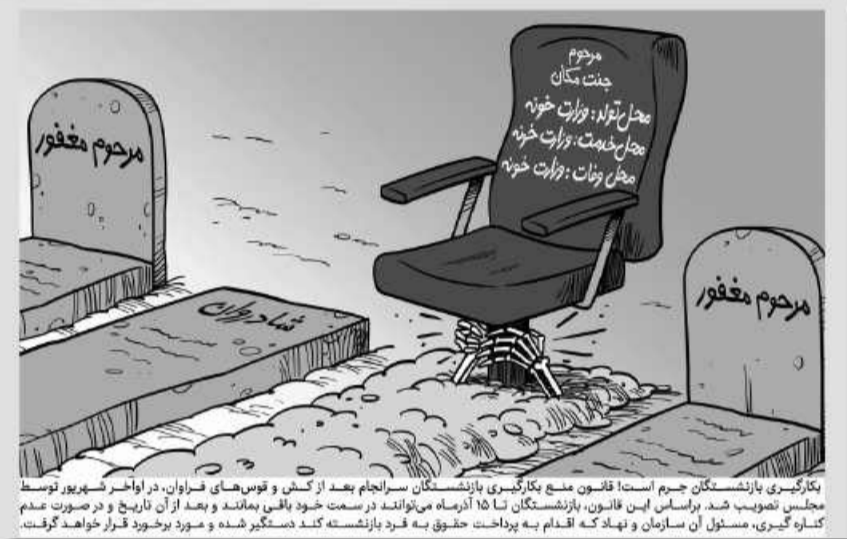
بکارگیری بازنشستگان جرم است! قانون منع بکارگیری بازنشستگان سرانجام بعد از کش و قوس های فراوان، در اواخر شهریور توسط مجلس تصویب شد. براساس این قانون، بازنشستگان تا ۱۵ آذرماه می توانند در سمت خود باقی بمانند و بعد از آن تاریخ و در صورت عدم کسره گیری، مسئول آن سازمان و نهاد که اقدام به پرداخت حقوق به فرد بازنشسته کند دستگیر شده و مورد برخورد قرار خواهد گرفت.