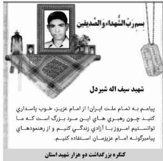
شهید سیف اله شیردل

پیام به تمام ملت ایران! از امام عزیز، خوب پاسداری کنید چون رهبری های این مرد بزرگ است که ما توانستیم امروز با آزادی زندگی کنیم و از رهنمودهای پیامبرگونه امام عزیزمان استفاده کنیم.