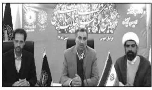
مهندس کانون پرورش فکری کودکان و نوجوانان خراسان جنوبی اعلام کرد:

نیروی برق، ۴۰ برنامه و طرح توسط فناوری اطلاعات و ۳ طرح و پروژه توسط منابع طبیعی و آبخیزداری استان به عنوان اعضای کارگروه مذکور در دهه فجر خبر داد.