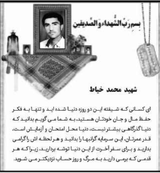
بسم رب الشهداء والصدیقین