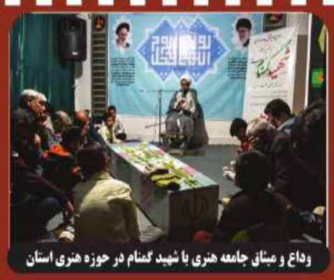
وداع و مینای جامعه هنری با شهید گمنام در حوزه هنری استان