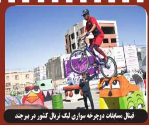
فینال مسابقات دوچرخه سواری لیگ تریال کشور در بیرجند