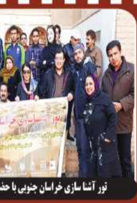
تور آشناسازی خراسان جنوبی با حضور نور گردانان کشوری

شهرکی در ادامه به برنامه های این مجموعه در حوزه