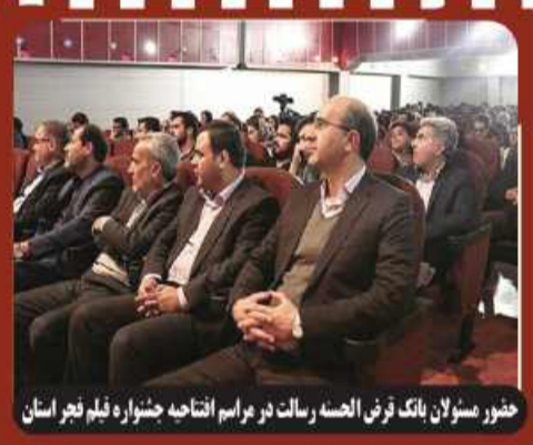
حضور مسولان بانک قرض الحسنه رسالت در مراسم افتتاحیه جشنواره فیلم فجر استان