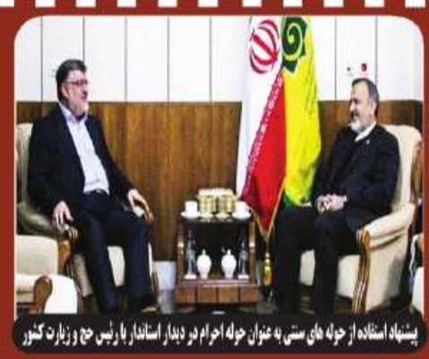
پیشنهاد استاده از چله های سنی به عنوان چله احوام در دیدار استاندار بارسی حج و زیارت کوز