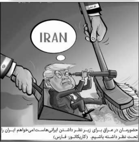
حضورمان در عراق برای زیر نظر داشتن ایرانی‌هاست، می‌خواهم ایران را تحت نظر داشته باشیم.