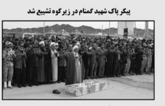
یکر پاک شهید گمنام در زیر کوه تشییع شد

امروز خراسان جنوبی - گروه خبر همزمان با سالروز شهادت حضرت فاطمه زهرا (س) پیکر پاک شهید گمنام دفاع مقدس روز گذشته در روستای «افین» شهرستان زیرکوه تشییع و خاکسپاری شد. آیین وداع با پیکر مطهر این شهید گمنام جمعه شب در مسجد حضرت فاطمه زهرا (س) شهر حاجی آباد زیرکوه برگزار شد. پیکر مطهر این شهید گمنام ابتدا بر روی دستان مردم شهید پرور حاجی آباد و زیرکوه تشییع و سپس در روستای افین به خاک سپرده شد. این شهید گمنام ۲۳ ساله در عملیات ایذایی والفجر هشت دفاع مقدس در منطقه بوارین به فیض شهادت نائل آمده بود.