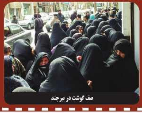
صف گوشت در بیرجند