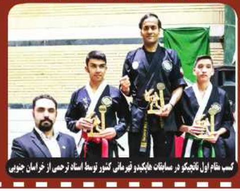
کسب مقام اول نانچیکو در مسابقات نایچیکو قهرمانی کشور توسط نونهالان استان