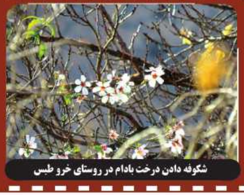
شکوفه دادن درخت بادام در روستای خرو طبس