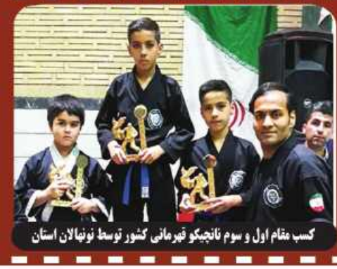
کسب مقام اول و سوم نانچیکو قهرمانی کشور توسط نونهالان استان