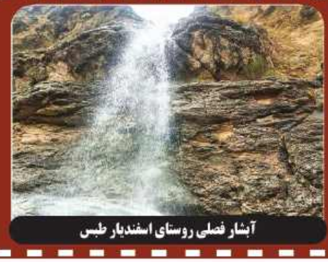
آبشار فصلی روستای اسفندیار طبس