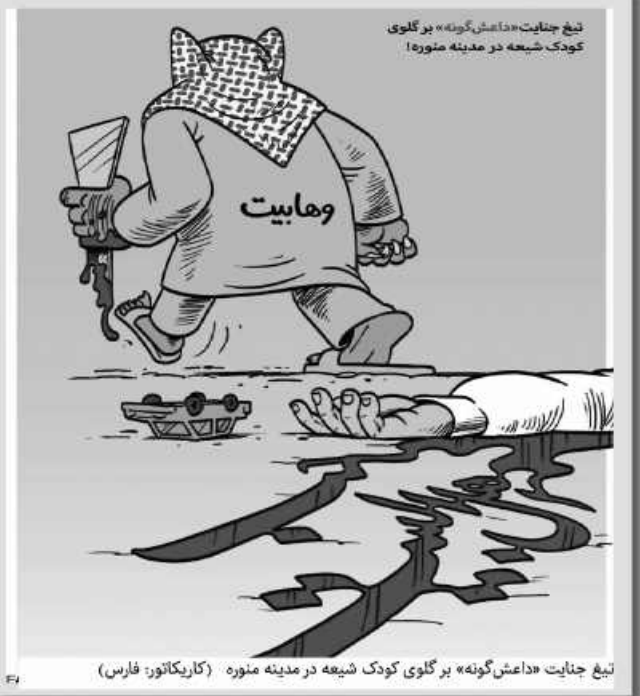
تیغ جنایت «داعش گونه» بر گلوی کودک شیعه در مدینه منوره (کاریکاتور: فارس)

به خراسان جنوبی رسید امروز خراسان جنوبی- گروه ورزش مسابقات کاراته قهرمانی کشور بانوان گرامیداشت دهه مبارک فجر با معرفی تیم های برتر به پایان رسید. این مسابقات با حضور ۱۴ تیم و ۳۰۰ بازیکن در ۷ سبک ( به میزبانی سبک بزرگ دن دوکای کاراته) از سراسر کشور در مجموعه