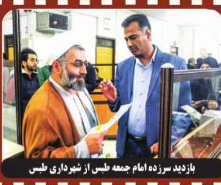
بازدید سرزده امام جمعه طبس از شیرداری طبس