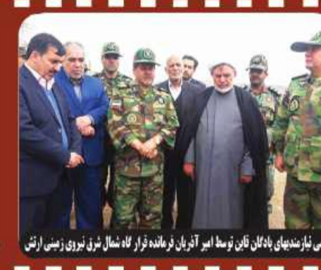
زور می‌نوازند بهانه‌ها مان تا ن توسط امیر آذربایان فرمانده قرارگاه شمال شرق نیروی زمینی ارتش