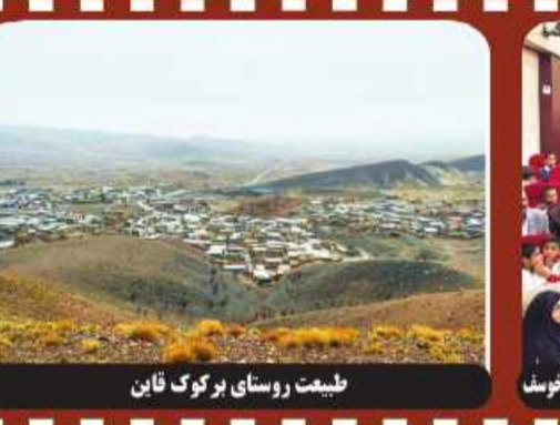
طبیعت روستای برکوک فاین

خاتم‌ها به استادیوم بروند» در پاسخ به او افشار تأیید کرد: «همیشه خیلی راحت حق چپه‌رو او بود. شباهت فراوان مهناز افشار به فافقه آتشین خواننده پیش از انقلاب در شهرت او در اواخر دهه هفتاد و اوایل دهه هشتاد تأثیر به‌سزایی داشت. حالا دیگر کمتر کسی است که مهناز افشار را نشاناند. البته نه به خاطر بازی‌های درخشانش در عالم سینما که فقط به خاطر اظهارنظرهای بی‌ربطش در حوزه‌های مختلف و حواشی بسیار زیادش است. مهناز افشار در صفحه اینستاگرام خود حدود ۸ میلیون دنبال کننده دارد. این رقم نجومی به معنای آن است که ۱۰ درصد از کل جمعیت ایران، فقط اینستاگرام افشار را دنبال می‌کنند. از طرفی اگر نگاهی به آمار فروش آخرین فیلم‌های افشار ببیندازد متوجه می‌شود که تعداد زیادی از این افراد کارهای خانم افشار را دنبال نمی‌کنند. از حواشی دیگری که مهناز افشار در سال‌های اخیر درگیر آن بوده است می‌توان به نقش آفرینی‌های سیاسی و مدنی او اشاره کرد. افشار در دو سال اخیر حضور پررنگی در شبکه‌های اجتماعی دارد و درباره مسائل مختلف اظهار نظر می‌کند. او سعی می‌کند در قامت حامی حقوق زنان ظاهر شود. در این راستا سال گذشته در جریان یک موضع‌گیری از سحر قریشی درباره حضور زنان در ورزشگاه‌ها مهناز افشار به تندی به او تاخت. قریشی گفته بود: «دوست ندارم بروم استادیوم، از اینکه کنار تعداد زیادی آقا قرار بگیرم، منقلب می‌شوم. کاملاً موافقم که اجازه نمی‌دهند