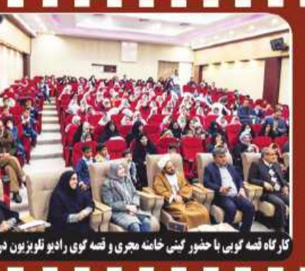
کارگاه فقه کوبی با حضور کینی خانه مجری و فقه گوی رادیو تلویزیون در خوسف