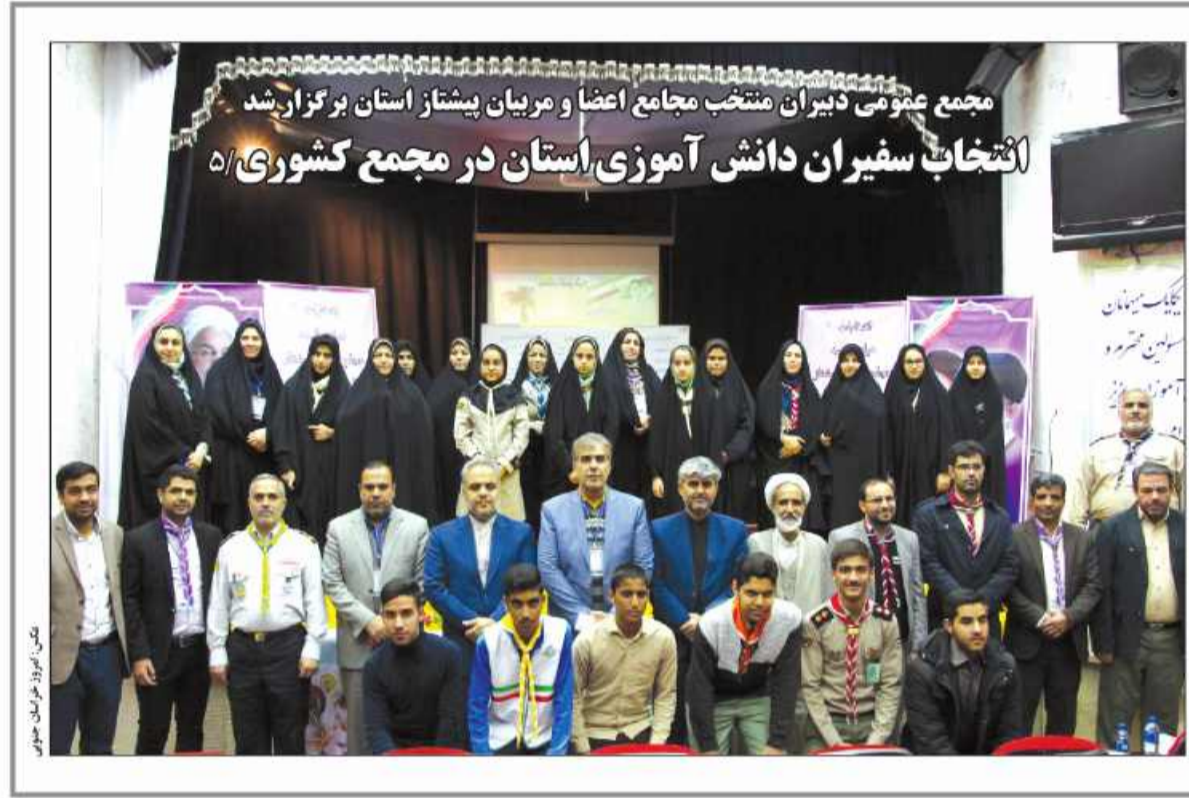
مجمع عمومی دبیران منتخب مجامع اعضا و مربیان پیشواز استان برگزار شد انتخاب سفیران دانش آموزی استان در مجمع کشوری ۵/