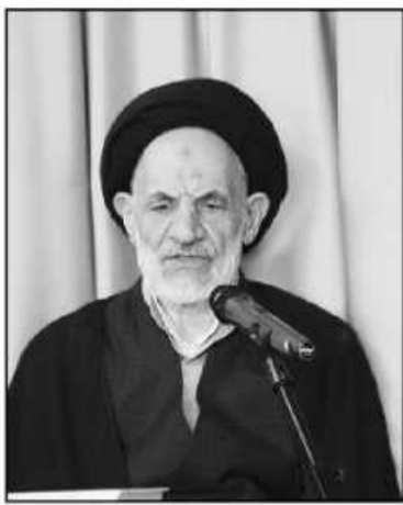
اینکه مشکلات را مشاهده می‌کنند همچنان به راه خود ادامه می‌دهند.