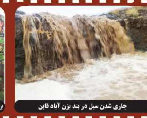
جاری شدن سیل در بند بزن آباد فاین