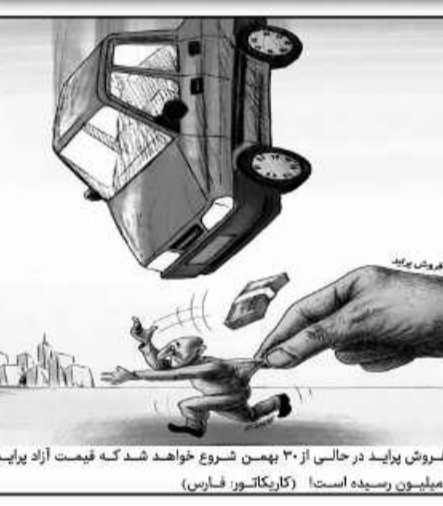
پیش فروش براید در حالی ۳۰ بهمن شروع خواهد شد که قیمت آزاد براید در بازار به ۴۷ میلیون رسیده است!