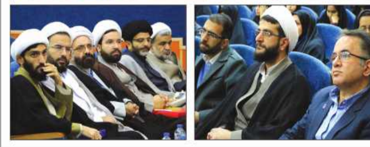
گلیه های فراوان دانشجویان