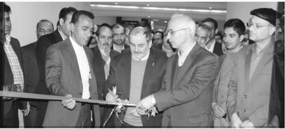
باعث ایجاد ثروت و ارتقای معیشت دانشجویان در جوار صنایع باشد.

ثبت نام از ۲۰ دانشجو برای رشته امور گمرکی در ۴۸ ساعت وی اضافه کرد: این مرکز در حال حاضر با سه رشته امور گمرکی، بهداشت و ایمنی و بازاریابی که نیاز این استان است راه اندازی شده و ظرفیت ۴۸ ساعت ۲۰ نفر در رشته امور گمرکی این مرکز ثبت نام کرده اند. وی اظهار کرد: ایجاد مرکز بین الملل و مرکز رشد و نوآوری نیز می تواند با توجه به وجود سایت مرزی و زمینه های مورد نیاز دیگر در منطقه ویژه اقتصادی مؤثر واقع شود.