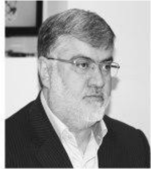
استاد خراسان جنوبی خبر داد:

معرفی ظرفیت های استان و بررسی مسائل و موانع تسهیل و توسعه روابط و مبادلات مرزی از اهداف این سفر است