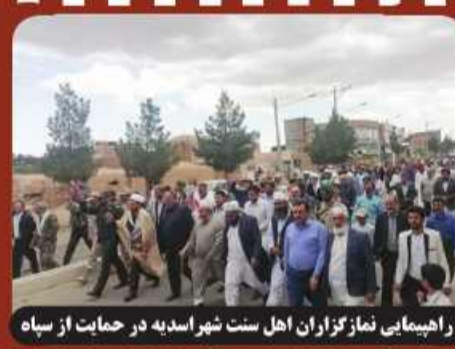
اقدام برخی کسه بریشه نست به این و کام درب مغازه ها / سیل شدید در محور طبس اصفهان / تلاش اهالی روستای اندریک فاین برای پیشگیری از خسارت سیل / راهبیمایی اقشار مختلف شهردر ح در حمایت از سیاه / راهبیمایی نمازگزاران اهل سنت شهراسیده در حمایت از سیاه