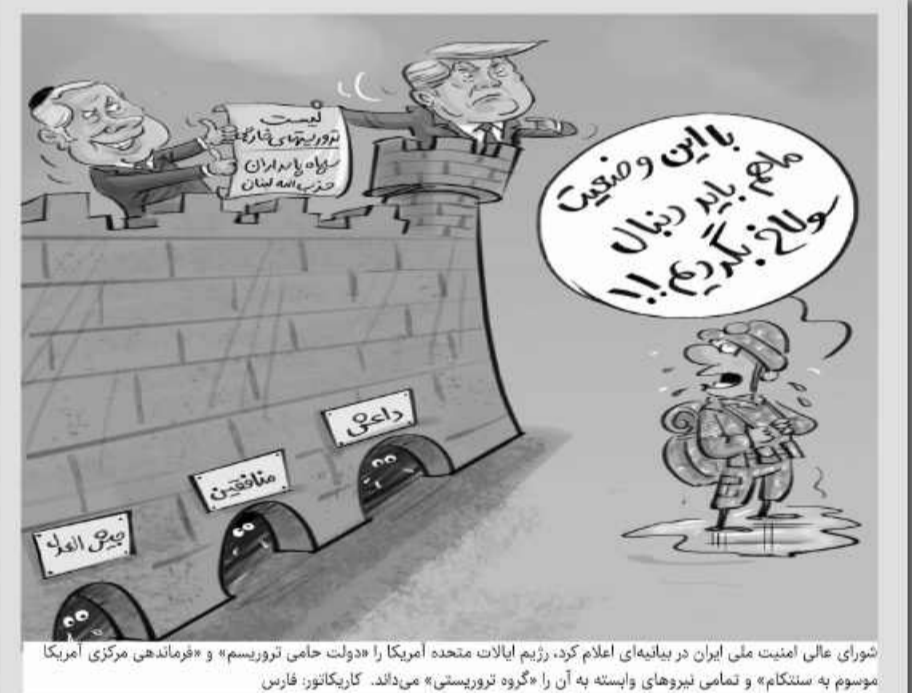
شورای عالی امنیت ملی ایران در بیانیه ای اعلام کرد، رژیم ایالات متحده آمریکا را «دولت حامی تروریسم» و «فرماندهی مرکزی آمریکا موسوم به سنکام» و تمامی نیروهای وابسته به آن را «گروه تروریستی» می داند.