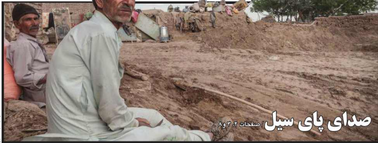
صدای پای سیل // صفحات ۲، ۳ و ۸

در میزگرد ۵ ساعته روزنامه امروز خراسان جنوبی بررسی شد