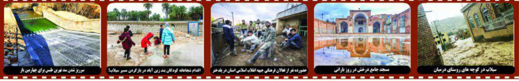
بروز شدن سد برون طس برای چهارم بار / اقدام شجاعت کودکان بند زین آناه در باز کردن مسیر سیلاب / حضور ده نفر از فعالان فرهنگی جنبه انقلاب اسلامی استان در پلاندختر / مسجد جامع درخش در روز بارانی / سیلاب در کوجه های روستای درمیان