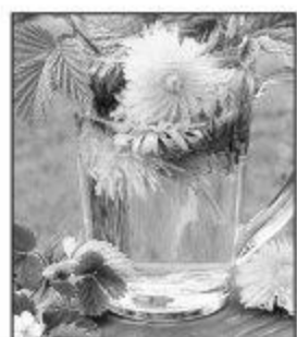
روشنی و مایع حاصل از چندین بار در طول روز مصرف کنید.

ارمغان جنوبی - خویی khooi@birjandemrooz.com