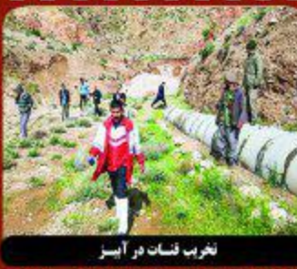
تخریب فسات در آبسر