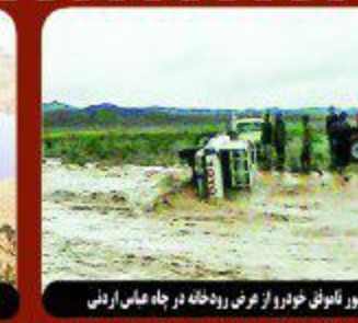
مور تانوک خورو از عرض رودخانه در جاه های ارنی