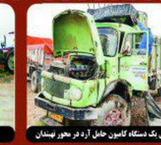
واژگونی یک دستگاه کامیون حامل آرد در محور نهمینان