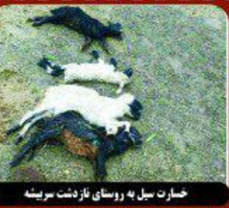
خسارت بیل به روستای ناز دشت بریینه

فقط در نفت گاز داریم لذا متنوع بودن قیمت باعث به وجود آمدن قاچاق سوخت می شود. مردانی افزود: هم اکنون قیمت نفت گاز در حمل و نقل ۳۰۰ تومان، موانع انعطاری ۲۰۰ تومان، مرز نشینان سه هزار و ۵۰۰، بازرچه های مرزی پنج هزار و ۲۰۰ تومان و در بخش نیروگاه ها به صورت تهاجمی توزیع می شود. وی بیان کرد: به علت ارز هم عاملی بر قاچاق سوخت بوده به شکلی که فروردین و اردیبهشت سال گذشته بیشترین عرضه فرآورده نفت گاز غیر متعارف را در نهمین داشتیم. مدیر شرکت ملی پخش فرآورده های نفتی منطقه خراسان جنوبی گفت: همین مسئله باعث شد برای اولین بار نهمین رتبه اول مصرف بیش از حد نفت گاز کشور را کسب کرد. وی با اشاره به تلاش های فراوان برای مدیریت، کنترل و نظارت بر عرضه سوخت در نهمین گفت: بدون کم شدن حتی لیتر سهمیه میزان مصرف فرآورده در ماه های انتهاپی تابستان سال گذشته ۵۸٫۱ درصد به ۲ درصد رسید و این رقم کشوری ۵۱٫۷ درصد بوده که خراسان جنوبی پنج درصد است. مردانی اضافه کرد: مصرف بنزین در خراسان جنوبی نیز از ۱۱۹٫۱ درصد به ۲۰ درصد رسیده که امیدواریم تا ماه های آینده به نرم کشوری نزدیک تر شود. وی دربارہ آمار توزیع فرآورده های نفتی استان در سال ۹۷ نسبت به سال ۹۶ نیز بیان کرد: مصرف بنزین در سال گذشته ۳۱ میلیون و ۱۹۹ هزار لیتر بوده که نسبت به سال ۹۶ رشد ۱۷٫۵ درصدی داشته است. مدیر شرکت ملی پخش فرآورده های نفتی منطقه خراسان جنوبی گفت: سال ۹۷ در خراسان جنوبی ۷۱ میلیون و ۳۲۸ هزار لیتر نفت سفید توزیع شد که این رقم در سال قبل آن ۸۲ میلیون و ۳۲۸ هزار لیتر بود و نشان می دهد که مصرف نفت سفید در سال گذشته حدود ۹ درصد