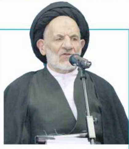
انتقاد نماینده ولی فقیه از ضعف نظارت

۲۵ هزار و ۸۶۶ متر مربع اراضی ملی رفع تصرف شد