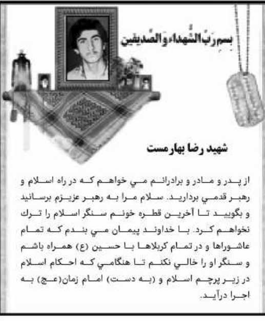
بسم رب الشهداء و الصدیقین