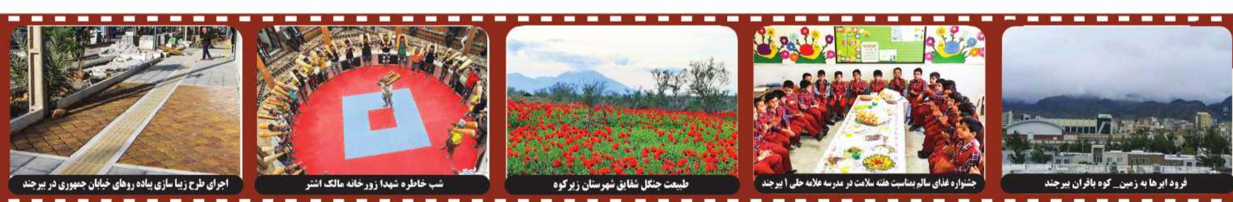
اجرای طرح زیبا سازی پیاده روهای خیابان جمهوری در بیرجند / شب خاطره شهدا زور خانه مالک اشتر / طبیعت جنگل شقایق شهرستان زیرکوه / جشنواره غذای سالم بنسبیت هفته سلامت در مدرسه علامه حلی ا بیرجند / فرود ابرها به زمین... کوه باقران بیرجند

رئیس دانشگاه علوم پزشکی بیرجند با بیان اینکه ۵۰۰ واحد بهداشتی در خراسان جنوبی فعال است، گفت: همچنین پرونده سلامت الکترونیک ۷۹ درصد جمعیت استان تکمیل شده است. دکتر محمد دهقانی فیروزآبادی در دیدار با نماینده ولی فقیه در خراسان جنوبی به مناسبت هفته سلامت اظهار داشت: حوزه بهداشت که حوزه پیشگیری و مراقبت های اولیه است اولویت حوزه درمان است و در حوزه بهداشت، توجه جدی به موضوعات پیشگیری می شود. وی افزود: خدمات در حوزه بهداشت به طور کامل رایگان انجام می شود ولی هزینه های حوزه درمان گزاف و سنگین است که خانواده ها و دولت نمی تواند تمام هزینه ها را پوشش دهد. وی گفت: دلایل متعددی حوزه پیشگیری را بر حوزه درمان ترجیح می کند و امسال که بر مراقبت های بهداشتی های اولیه تأکید می شود، دانشگاه علوم پزشکی نیز، هم راستا با سیاست های حوزه بهداشت گام برداشته و حدود ۵۰۰ واحد مختلف بهداشتی در استان شامل خانه های بهداشت، پایگاه های بهداشت و مراکز جامع خدمات سلامت خدمات ارائه می