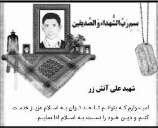
شهید علی آتشی زر

امیدوارم که بتوانم تا حد توان به اسلام عزیز خدمت کنم و دین خود را نسبت به اسلام ادا نمایم.