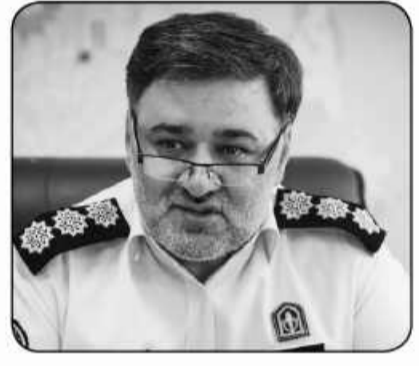
بیان کرد: در جدیدترین کشفیات پلیس مبارزه با موادمخدر، محموله اقلام مختلف آغشته به انواع موادمخدر کشف و ضبط شد.

سرهنگ بخشنده گفت: در جدیدترین کشفیات پلیس مبارزه با موادمخدر، محموله اقلام مختلف آغشته به انواع موادمخدر کشف و ضبط شد. سرهنگ محمد بخشنده رئیس پلیس مبارزه با موادمخدر تهران بزرگ در گفتگو با باشگاه خبرنگاران جوان، در خصوص جدیدترین شیوه فعالیت قاچاقچیان گفت: این افراد برای آنکه به اهداف خود برسند، به دنبال شیوه های جدید برای انجام فعالیت های خود هستند؛ لذا پلیس هم از این شگردها غافل نیست و با اشرافیت کامل اطلاعاتی سعی در بر ملا کردن نقشه های سوداگران دارد. سرهنگ بخشنده با اشاره به آخرین نمونه کشف شده از قاچاقچیان