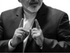
گمان نمی‌کنم وزیر امور خارجه آمریکا به جنگ با ایران...