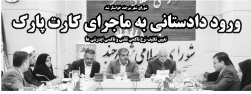
مدعی العموم می تواند ورود پیدا کند.