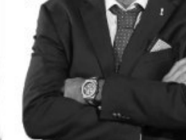
یک روز بیشتر در هتل مانند به خاطر اینکه اعضای کادر فنی تیم پول خود را می‌خواستند اما هرگز به هتل ما نیامد و تلقین همدا خود را خاصش کرد.