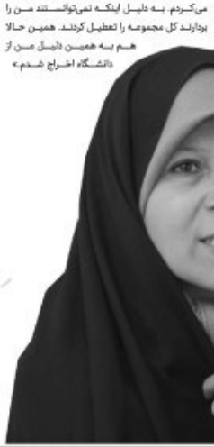
کند اما آقای هاشمی عهده مناسب خود را...