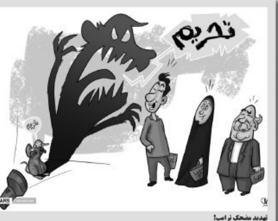
تهدید مشخص تر است!

امروز خراسان جنوبی - اورش تیم فوتبال بیرجند به مسابقات مناطق فوتبال کشور رده سنی بزرگسالان (سمتة سوم) اعزام می شود. حسین زاده افزود: این مسابقات از روز دوشنبه ۸ اردیبهشت آغاز و در قالب چهار گروه با حضور ۲۸ تیم برگزار می شود. وی تصریح کرد: تیم پیشگامان بیرجند در گروه سوم به میزبانی اصفهان در شهرستان می