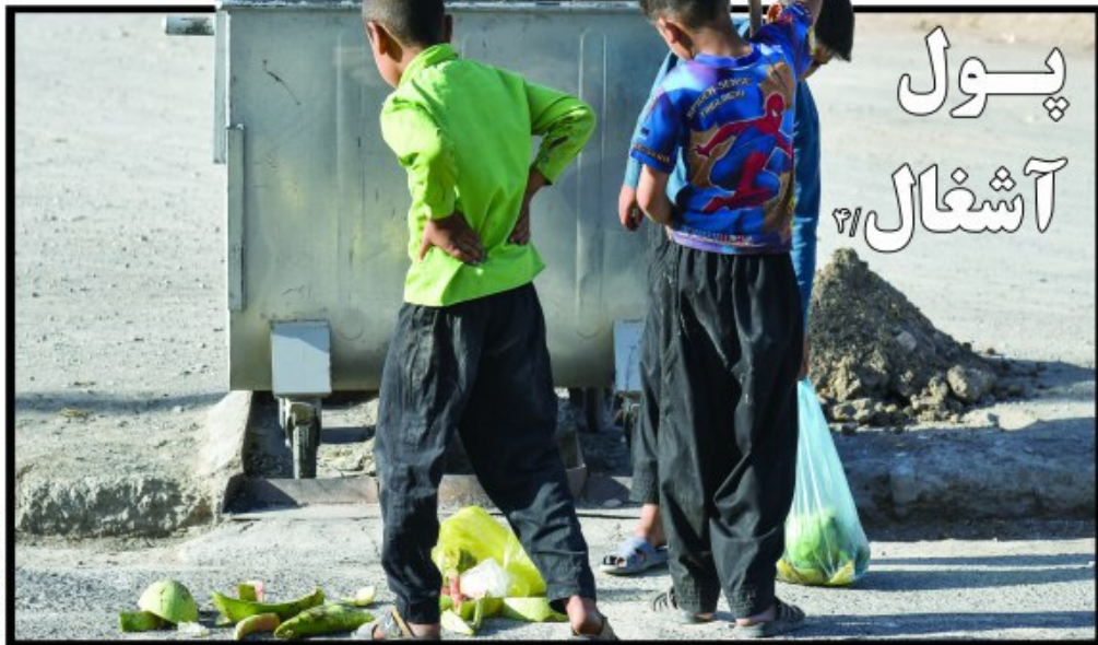
شورای شهر بیرجند خواستار شد