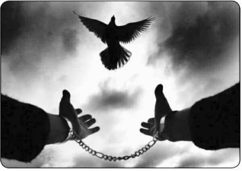
۱۷۵ نفر زندانی غیر عمد در استان

جرم ۷۴ درصد زندانی های استان مواد مخدر است فقط ۹ زندانی عفو شده بازگشت به زندان داشته ایم