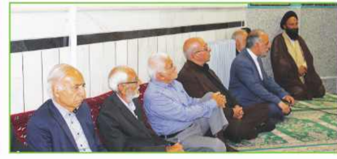
تلاش شرکت فروزان بیرجند برای ایجاد اشتغال خانگی