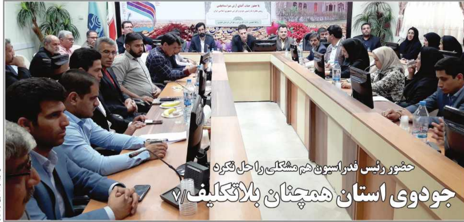
حضور رئیس فدراسیون شمشکی را حل نکرد جودوی استان همچنان بلا تکلیف

ثبت ۵ موقوفه جدید طی سال جاری در استان ۳۵ درصد موقوفات تخریبی در بیرجند دارای متولی است