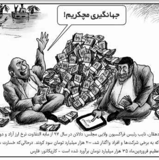
دختران، نایب رئیس فراکسیون ولایت مجلس، دلان در سال ۹۷ از مابه التفاوت نرخ ارز آزاد و دولتی که به برخی شرکت ها و افراد واگذار شد، ۲۰۰ هزار میلیارد تومان سود کردند. درحالی که خسارت سیل عظیم فردین ۲۵ هزار میلیارد تومان برآورد شده است - کاریکاتور: فارس

مصرف بیش از حد مواد غذایی شیرین و پرچرب و سرخ شده (از جمله آش رشته غلیظ، حلیم، زولبیا و بامیه و انواع شیرینی) هنگام افطار منجر به تشنگی می شود و مصرف افطار سبب اختلال در هضم مواد غذایی می شود. بعد از صرف سحری نیز بسیاری از روزه داران از بیسم تشنگی در طول روز به مقدار فراوان آب می نوشند که عادت صحیح غذایی نیست.