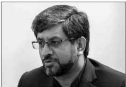
رئیس سازمان صنعت، معدن و تجارت خراسان جنوبی گفت: پیش بینی می شود امسال ۱۰۰۰ میلیارد تومان

در استان سرمایه گذاری شود. رئیس سازمان صنعت، معدن و تجارت استان گفت: تحقق این میزان سرمایه گذاری از طریق تکمیل ۱۰ طرح صنعتی و معدنی در حال اجرا در سال ۹۸ استان خواهد بود. شهرکی با اشاره به اشتغال این طرح ها افزود: پیش بینی می شود با راه اندازی کامل این طرح ها برای هزار و ۵۰۰ نفر اشتغال مستقیم ایجاد شود.