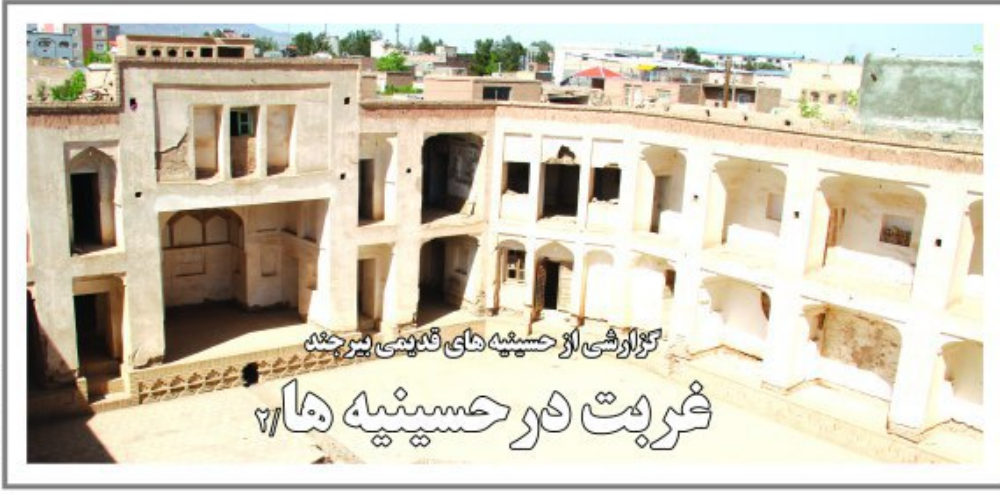
نگارگری از حسینیه های قدیمی بیرجند خرابت در حسینیه ها

مدیریت درمان دانشگاه علوم پزشکی بیرجند: تعهدی برای تأمین نیروی متخصص مراکز درمانی نداریم کمک از پلیس قنا برای شناسایی متخلفان نوبت فروشی