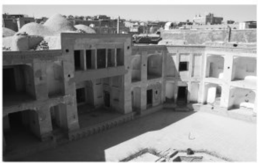
پیش برمی گردد و در طول تاریخ هم پدیداری قطعات گوناگون اسم از چهل سیاسی، نظامی و کسبه بوده است.

مرمت احیا و البته نگهداری این بنای تاریخی بسیار می شد اما به نظر می رسد هنوز هم خیلی دیر نشده و می توان با اختصاص اعتبار نسبت به احوالی آن کام برداشت.