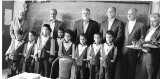
امروز خراسان جنوبی- گروه خبر استاندار خراسان جنوبی به طور سرزده در دبستان امام حسن (ع) شمال شهر بیرجند حاضر شد و با اهدای شانه گل هفته معلم را به آموزگاران این آموزشگاه تبریک گفت. به گزارش امروز خراسان جنوبی، محمد صادق معتمدیان در این بازدید خطاب به آموزگاران این دبستان گفت: معلم نماد ایثار و فداکاری و قلمی فداکار در جامعه ماست. وی از اهدای ۳۰ دستگاه رایانه به ارزش ۱۶ میلیون تومان به این آموزشگاه خبر داد و افزود: استانداری خراسان جنوبی و اداره کل نوسازی، توسعه و تجهیز مدارس استان ۴ کلاس این آموزشگاه را با اعتباری بالغ بر ۶۰ میلیون تومان هوشمندسازی می کنند. استاندار خراسان جنوبی از تخصیص مبلغ ۲ میلیون ۴۰۰ هزار تومان برای انجام فعالیت های آموزشی و پرورشی این آموزشگاه خبر داد و تصریح کرد: همچنین استانداری خراسان جنوبی پیگیر احداث فضای ورزشی در زمین جنب این آموزشگاه بوده

و در تهیه لوازم ورزشی مورد نیاز آن با آموزش و پرورش همکاری می نماید. معتمدیان در ادامه خطاب به دانش آموزان دبستان امام حسن (ع) افزود: شما دانش آموزان باید قدرتان را در درجه های اول و دوم ابتدایی فعالیت می کنید.