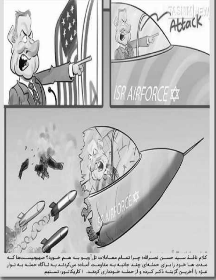
کلام نافذ سید حسن نصرالله؛ چرا تمام معادلات تل آویو به هم خورد؟ صهیونیستها که مدت ها خود را برای حمله ای چند جانبه به مقاومت آماده می کردند به ناگاه حمله به نوار غزه را آخرین گزینه ذکر کرده و از حمله خودداری کردند.