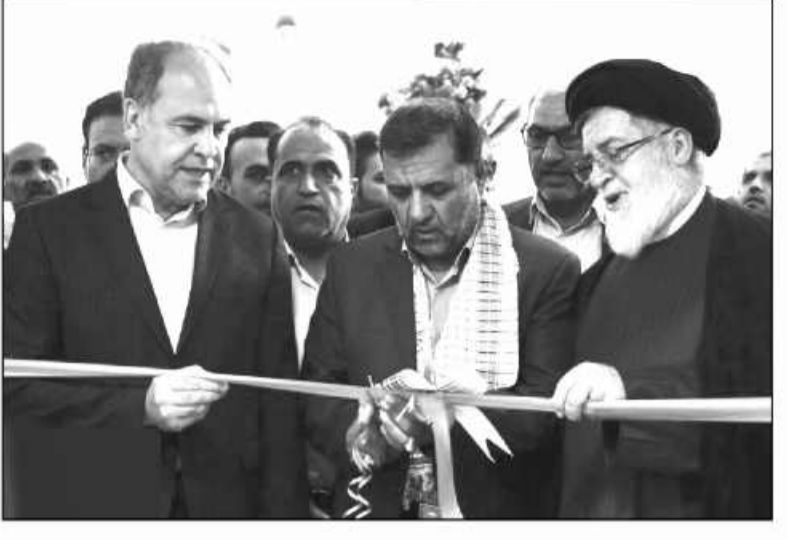
کند. وی کتابخانه ها را بسیار ارزشمند دانست و گفت: باید تلاش کنیم تا نسل جوان به کتابخوانی عادت کنند و با فرهنگ کتابخوانی آشنا شوند.