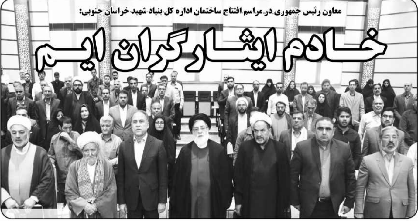
معاون رئیس جمهوری در مراسم افتتاح ساختمان اداره کل بنیاد شهید خراسان جنوبی: