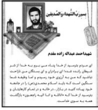
شیخ محمد عبدالله زاده مقدم