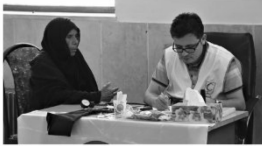
میزی باشند. همزه درعان فرزندان را نادران

۶ هزار نفر از مردم در روستاهای خراسان جنوبی از خدمات رایگان در طرح نذر آب بهره مند شدند. طرح نذر آب یا تأکید فراسویون جهانی ملیب سرخ و هلال احمر در مناطقی که دچار خشکسالی هستند و در دو محور تأمین آب آشامیدنی و سلامت شامل خدمات درمانی، ویزیت رایگان و جراحی سزا می شود. تکمالی نیز در کشور سالهاست ادامه دارد به همین علت خیلی از اهالی استان های کرمان، یزدگان، خراسان جنوبی و سیستان و بلوچستان یا مهاجرت کردند و یا هم در حال مهاجرت هستند به همین علت برای تثبیت جمعیت و پلایا بردن خدمات، طرح «نذر آب» چند سالی است که در کشور در حال اجرا است. انجام طرح نذر آب تا ۷ مهر در این طرح خدماتی همچون درمانی، توزیع سبب کالا و تاکرهای آب برای دسترسی مردم به آب شرب سالم به اهالی روستاهای داده می شود. طرح ملی نذر آب امسال از ۱۰ مرداد در خراسان جنوبی آغاز شد و تا ۷ مهر در سه حوزه سلامت، معیشت و مخازن آب در مناطق محروم این استان خدمات رسائی می کند. به اتفاق جمعی از مسئولان من هم راهی مناطقی از تبسین و چاب قیاس هورستان نهندان شدم که چند روزی نبود تعدادی از پزشکان و پرستاران در آن مستقر بودند و ما محرم را برای خدمات دهی انتخاب کردیم. جوقانی را اهل خراسان رصوی دیدم، که پزشک متخصص و فوق تخصص غولشی، جراح چشم و چشمپزشک، اولوزوی، زسان، زامان، دندانپزشک و پرستار، کارشناس دارویی، مستدکار اجتماعی و روانشناس بودند و نشان می کنند تا در صدد افکاشان، مرخصی بر ازم مردم محروم مناطق