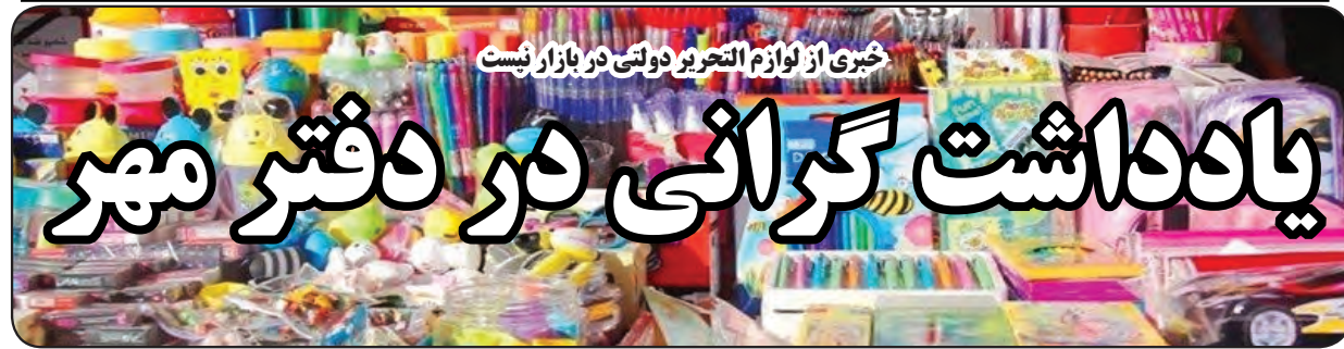
خبری از لوازم التحریر دولتی در بازار نیست

کارگروه زیربنایی، توسعه روستایی، عشایری، شهری و آمایش سرزمین و محیط زیست خراسان جنوبی برای بررسی و تصویب ۵۲ طرح از شهرستان برگزار شد که در نهایت ۲۱ طرح از دستور کار این جلسه طولانی ۴ ساعته خارج شد. در این جلسه همه طرح های شهرستان های نهبندان، سربیشه، سراپان و قاین تصویب شد. ۱۴ طرح مربوط به شهرستان درمیان، ۲ طرح شهرستان بشرویه و همچنین طرح های شهرستان زیرکوه به دلیل عدم حضور فرمانداران و نماینده ای از طرف این شهرستان ها از دستور کار خارج شد. در ادامه ۱۰ طرح شهرستان خوسف به تصویب رسید. طرح اردوگاه گردشگری و عشایری در حاشیه گواب شهر خوسف علی رغم