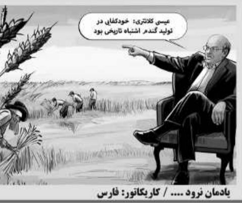
یادمان نرود .... / کار یکتاتور: فارس

سالن ورزشی شهید بصیری پور در نهبندان به مناسبت هفته دفاع مقدس افتتاح شد. به گزارش امروز خراسان جنوبی، برای این سالن ورزشی که ۳۱۰ مترمربع زیربنا دارد یک میلیارد تومان هزینه شده است.